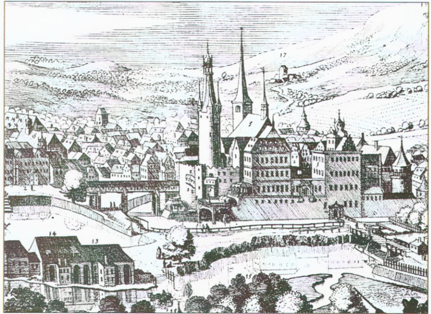
Bild 2-09 Ostseite (Ilmseite) des Schlosses Weimar mit Blick auf die Herzogin Anna Amalia Bibliothek und den Bibliotheksturm.

Das Bild überhöht die räumliche Situation und kennt nicht die natürlichen und baulichen Einzelheiten. Das betrifft auch die Anordnung von Schlossbrücke und Zugang zum Schloss von Osten. Im Vordergrund werden die Ilm und die Mündung des Leutra-Baches gezeigt. Die Stadtkirche ist willkürlich als Druckvorlage eingesetzt. Ein wesentlicher Vorteil der Karte ist die durch Spiegelung klar erklärte Lage von Wasser.