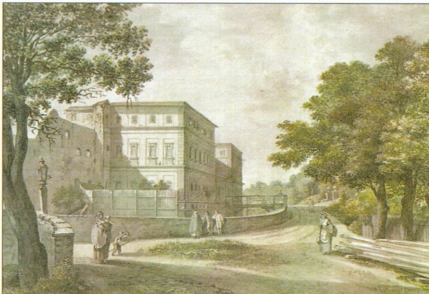
Bild 2-10 Ostseite des Schlosses, Blick nach Norden zur selben Brücke wie im Bild oben. Rechts ist die tief liegende Kerbe der Ilm angedeutet. Unter der Holzbrücke könnte man einen Wassergraben vermuten.

In Verlängerung der Holzbrücke nach rechts sind die Zugangs-säulen zur Steinbrücke über die Ilm zu erahnen. Der Weg im Vordergrund links deutet eine Brücke an.