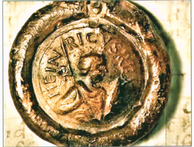
Bild 1-02 Siegel Königs Heinrich I., erster deutscher König aus dem Hause der Ottonen.

Die Kapitel 1 bis 7 der erzählten Geschichte RIADE Teil 5 konzentrieren sich auf die Bedeutung der Gewässer und Wasserbauten in Weimar.