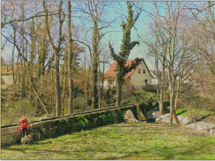
Bild 4-09 Das Wasserkreuz in Magdala – das Bauwerk überstand Starkregenzeiten, Eisgang, Frost, Sommergewitter und Strömung auch wegen ausreichender Durchlasshöhe.

Die Verzweigung eines Bachs stellte immer eine technische Herausforderung und für eine tiefer liegende Siedlung ein Risiko dar. Angesichts der um 900 wesentlich größeren Niederschlagsmengen als heute konnten die Wassermassen leicht Wehre und Durchlässe fortspülen. In solch einem Fall ist es sinnvoll, mit einer Holz- oder Steinplattenkonstruktion eine Wasser-Wasser-Brücke zu verlegen. Unabhängig vom Wetter fließt im Idealfall oben stets die gleiche Menge ab. Der Wasserüberschuss fließt seitlich nach unten in das Flutbett ab. Die lebenswichtigen Mühlen überstanden derart Unwetter und Missbrauch. In Magdala ist noch heute eine solche Anlage in Funktion.