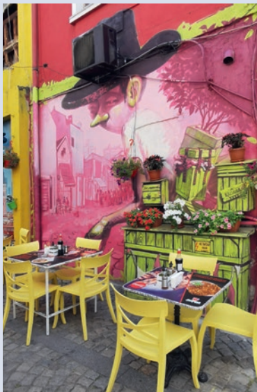
Ein Restaurantbesuch ist vergleichsweise günstig

Kölner Str. 20 58135 Hagen Tel. 02331/904741 www.wikinger.de Spezialisiert auf Natur- und Abenteuerreisen in den Bergregionen des Landes.