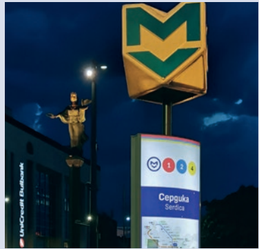
Öffentlicher Nahverkehr in Sofia

Der zentrale Pannendienst ist Sayuz na Balgarskite Avtomobilisti SBA, Ploshtad Pozitano 3, Sofia, Tel. 02 9 35 79 35, www.uab.org , mit etwas Glück spricht dort auch jemand Englisch.