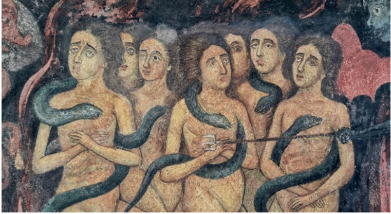
Sünderinnen auf einem Fresko im Rila-Kloster

während dieser Zeit eine enge Verbindung zwischen Kirche und der nationalen Befreiungsbewegung. Viele Klöster versteckten nicht nur Revolutionäre, sie entwickelten sich darüber hinaus zu Keimzellen des Widerstandes. Dies führte zu einer engen Verknüpfung von orthodoxer Kirche und nationaler Identität.