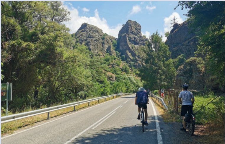
Radfahrer auf dem Weg in die Triglad-Schlucht

Bucht man rechtzeitig, ist auch der Flug nach Bulgarien nicht viel teurer. Vor allem in den Sommermonaten bedienen etliche Billigfluglinien neben Sofia auch die Schwarzmeermetropolen Burgas und Varna. Neben Ryanair, Easyjet und Wizz Air,