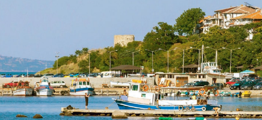
Der Hafen vom Nesebar an der südlichen Schwarzmeerküste