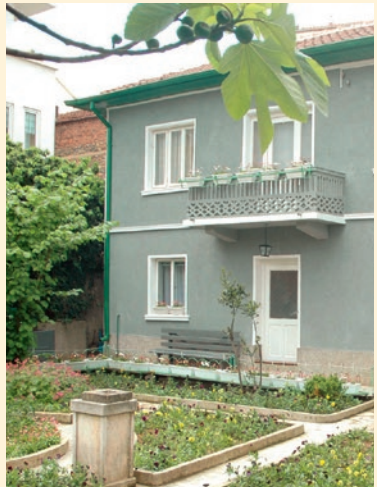
Das Haus Baba Wangas in Petrich

Überhaupt tendiert man auf dem Balkan zur Wunderheilung und glaubt gerne an Hellscherei. Baba Wanga ist nur eine Wahrsagerin unter vielen. Astrologinnen mit den hellseherischen Fähigkeiten erstellen aufgrund von Geburtsort und -zeit ganze Lebensläufe (aus Erfahrung des Autors sogar erstaunlich korrekt). Etlche kleine Dörfer haben kleine Kirchen mit dazugehöriger Hellschlerin und auch in den Städten weiß man, wen man aufsuchen muss, um einen Blick in die Zukunft zu werfen oder von dem einen oder anderen Zipperlein geheilt zu werden. Darüber kann man sich natürlich wunderbar lustig machen, es ist aber ein Teil der bulgarischen Kultur, der auch von durchaus gebildeten Leuten hochgehalten wird. Was Baba Wanga angeht: Seit 2023 keine Außerirdischen auf der Erde gelandet sind, weiß man, dass auch Hellschlerinnen manchmal im Dunkeln tappen und kann die restlichen Prophezeiungen beruhigt mit einer ordentlichen Portion Salz nehmen.