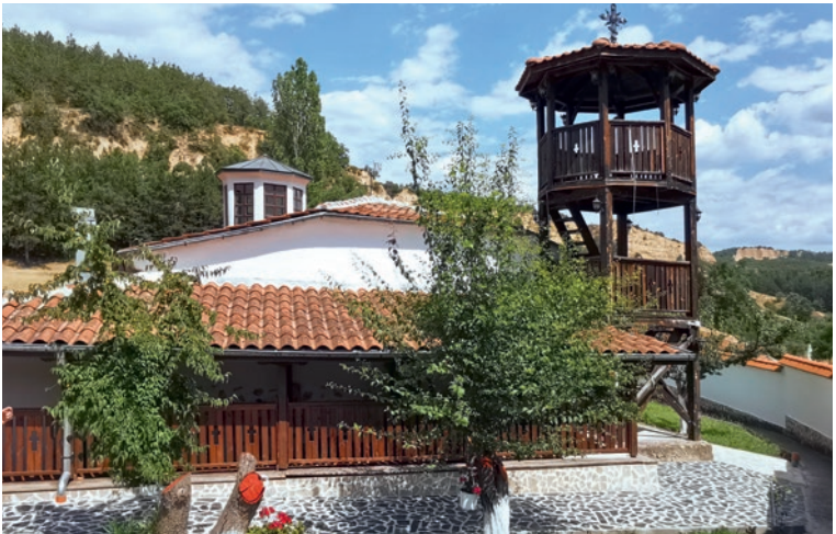
Hölzerner Glockenturm neben der St.-Georgs-Kirche in Zlatolist

Da mutet es nicht verwunderlich an, dass die United White Brotherhood (UWB) ihren Ursprung in Bulgarien hat. Diese christlich-esoterische Religion geht auf den bulgarischen Philosophen Peter Deunov (1864–1944) zurück und verbindet christliche Elemente mit östlichen Weisheiten, Yoga und Meditation. Auch wenn sich das Zentrum der Glaubensgemeinschaft nach Deunovs Tod nach Frankreich verlagert hat und die Zahl der heutigen Anhänger in Bulgarien unbekannt ist, wird wohl so ziemlich jeder Bulgare und jede Bulgarin sich wenigstens einmal mit seinen Schriften beschäftigt haben: Er gilt als bulgarischer Autor mit den meisten veröffentlichten Büchern. In realsozialistischen Zeiten war er vor allem bei der Intelligenzija beliebt und bot ein wenig spirituelle Abwechslung in der geistigen Tristesse. Erleben kann man die Brotherhood jeden August, wenn sich ein paar tausend Anhänger zum riesigen gemeinsamen speziellen Rundtanz, dem sogenannten Paneurhythmy an den sieben Rila-Seen treffen.