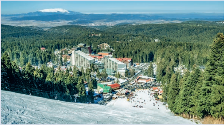
Das Wintersportzentrum Borovets im Rilagebirge

ren im Sommer sind Südbulgarien und der Region um Ruse zu verzeichnen. Allerdings sind in den Sommermonaten im ganzen Land Temperaturen über 30 Grad die Regel, auch mehrere Tage über 40 Grad sind eher die Regel als die Ausnahme. Während der Hauptsaison regnet es äußerst selten, nur in den Bergen gibt es nennenswerte Niederschläge. Während das restliche Land im Winter unter der Kälte schlottert, ist das Klima an der Schwarzmeerküste relativ mild, auch wenn die Wassertemperaturen nicht wirklich zum Schwimmen einladen. Kann man es sich aussuchen, ist die ideale Reisezeit von April bis Mitte Juni und Ende September/Anfang Oktober. Das Land ist grün, die Temperaturen sind angenehm und an der Küste beginnt bzw. endet die Badesaison. Entsprechend günstig sind in dieser Zeit auch die Übernachtungspreise. Ab Mitte Juni steigen die Temperaturen, selbst in den Bergen kann es ziemlich heiß werden. Während der Hochsaison im Juli und August ist vor allem die Schwarzmeerküste ziemlich überlaufen, auch, weil für die meisten Bulgaren der Sommerurlaub am Meer eine geliebte und gelebte Tradition ist. Hier sollte man auf jeden Fall im Voraus buchen, selbst im touristisch wenig entwickelten äußersten Süden und Norden der Küste ist kaum eine Unterkunft zu finden