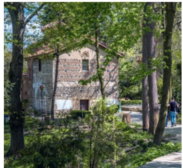
Die Kirche von Boyana

Dragalevtsi ist gut mit öffentlichen Verkehrsmitteln zu erreichen, mit der Metro-Linie 2 bis zur Endhaltestelle Vitosha und dann weiter mit dem Bus Nr. 93.