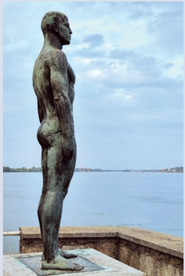
Der ›Schwimmer‹ in Vidin an der Donau