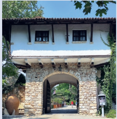
Eingang zum Botanischen Garten in Balchik

In den letzten Jahren haben sich bulgarischen Zahnärzte den Ruf erarbeitet, besonders gut und günstig zu sein. An der Schwarzmeerküste sind Zahnkliniken wie Pilze aus dem Boden geschossen und bieten Implantate und Kronen für einen Bruchteil der deutschen Kosten, mit anschließender Wellness am Strand. Zunehmend populär werden auch Schönheitsoperationen in Bulgarien.