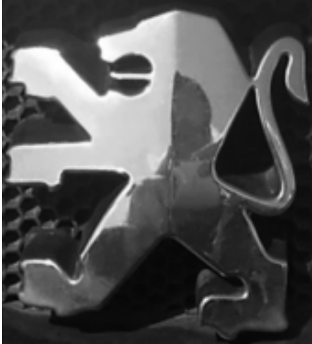
5. Der Peugeot-Löwe

Man könnte fast den Eindruck bekommen, als wäre Peugeot gar nicht Teil unserer physischen Realität. Existiert es denn überhaupt?