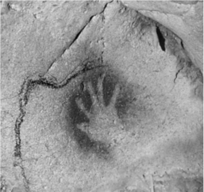
1. Abdruck einer menschlichen Hand in der Chauvet-Höhle in Südfrankreich. Diese Kunstwerke sind etwa 30 000 Jahre alt und wurden von Menschen hinterlassen, die aussahen, dachten und fühlten wie wir. Vielleicht wollte er oder sie sagen: »Ich war hier!«