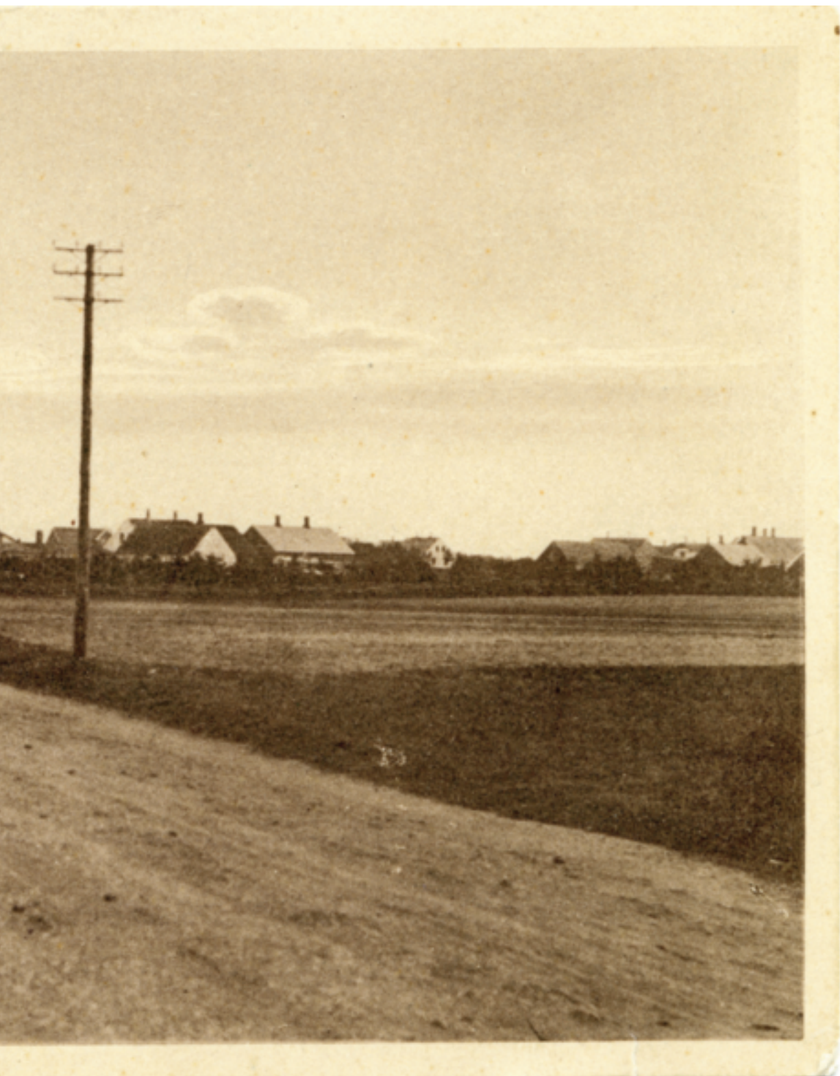
»Gruß aus Billund«. Postkarte aus den 1910er-Jahren. Billund von Westen her gesehen, mit Heidekraut neben der geschotterten Landstraße. Bei den weißen Gebäuden links handelt es sich um das Haus und die Werkstatt, die Ole Kirk 1916 kauft.