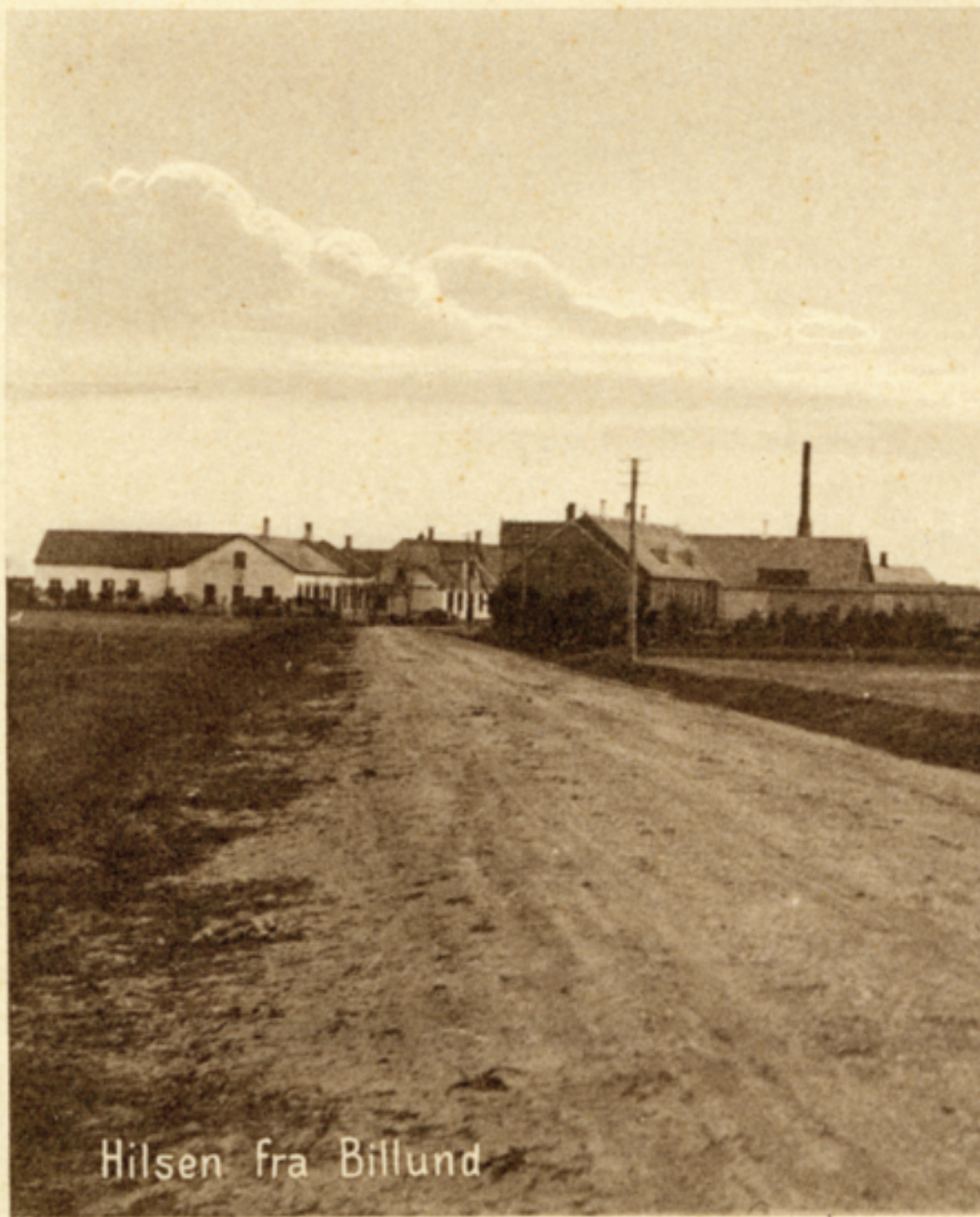
Hilsen fra Billund