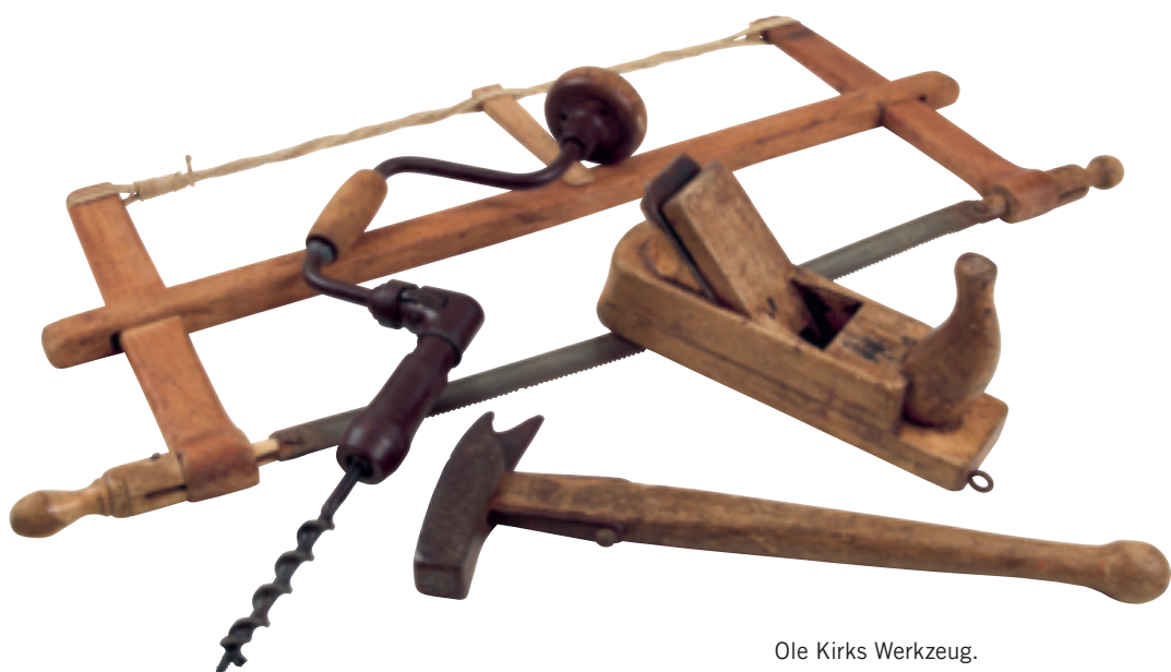
Ole Kirks Werkzeug.