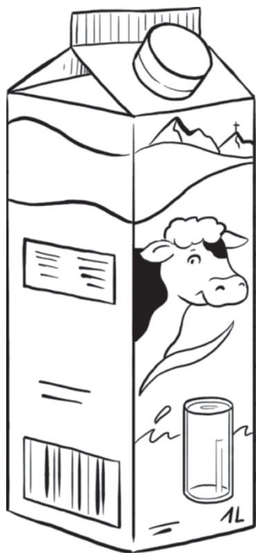
Milch- oder Saftkarton

Ob Mensch oder Vogel: Nicht jeder kann im Winter einfach in den warmen Süden fliegen! Bei Menschen ist Fliegen ohnehin alles andere als klimafreundlich. Tue stattdessen etwas für die Umwelt und die Vögel – mit diesem einfachen Vogelhaus holst du auch im tiefsten Winter Glück in deinen Garten oder auf den Balkon!