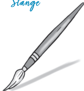
Pinzel und Farben