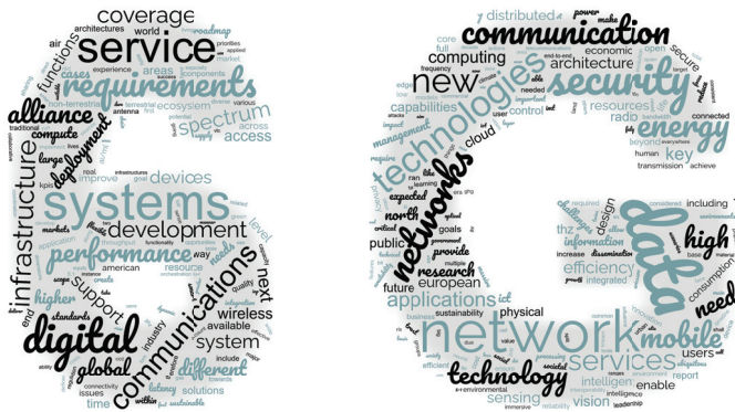
Abbildung 1.2: Wortwolke der drei White Paper aus China [42], der USA [47] und Europa [51].

lungen der physikalischen Schicht ergibt sich ein erheblicher Forschungsbedarf in den höheren Schichten, wie beispielsweise rund um den Themenblock der Netzwerktechnik, wie den Entwurf von Netzwerken von Netzwerken, also sub-Netzwerken oder Campusnetze, um auch hier nur ein paar Stellvertreter zu nennen. Der Fokus der vorliegenden Arbeit liegt jedoch ausschließlich auf der untersten, der physikalischen Schicht und umfasst neben der Kommunikationstechnik ebenso die Radartechnik. Gleichzeitig wird der mmWellen-Funkkanal adressiert, die Antennentechnologie thematisiert und darauf basierend die Qualität des Radars als auch der Kommunikation unter Diskussion der geteilten Wellenform des zukünftigen JCRS-Systems evaluiert. Der Systementwurf fokussiert sich dabei auf kombinierte Kommunikations- und Radarsysteme für den Automobilbereich.