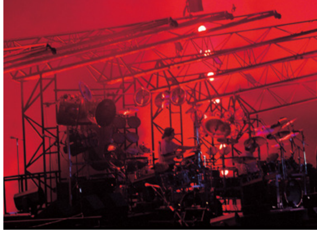
Livebilder von der Division Bell -Tour.