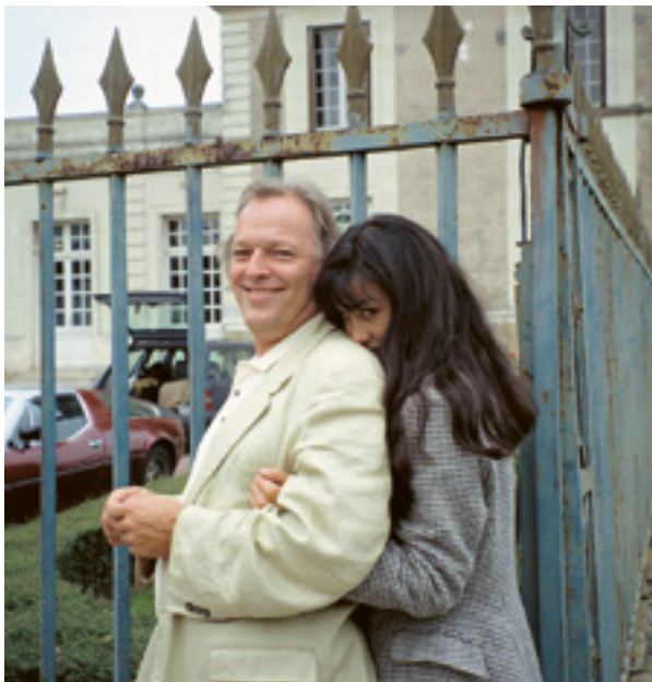
David Gilmour und Polly Samson – sie heirateten während der Division Bell -Tour im Juli 1994.