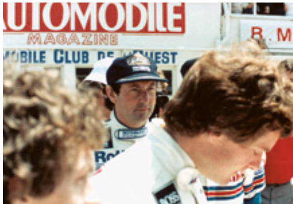
Le Mans 1984: in einem Porsche 956; Logos von Sponsoren aus der Tabakindustrie trug man damals ohne allzu große Bedenken.