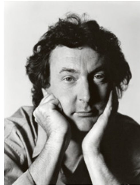
Promofoto von David Bailey zur Veröffentlichung von A Momentary Lapse Of Reason .