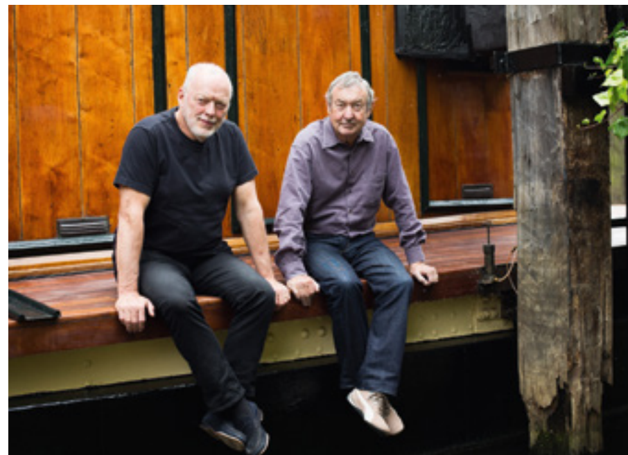
Auf der Astoria vor der Veröffentlichung von Endless River .