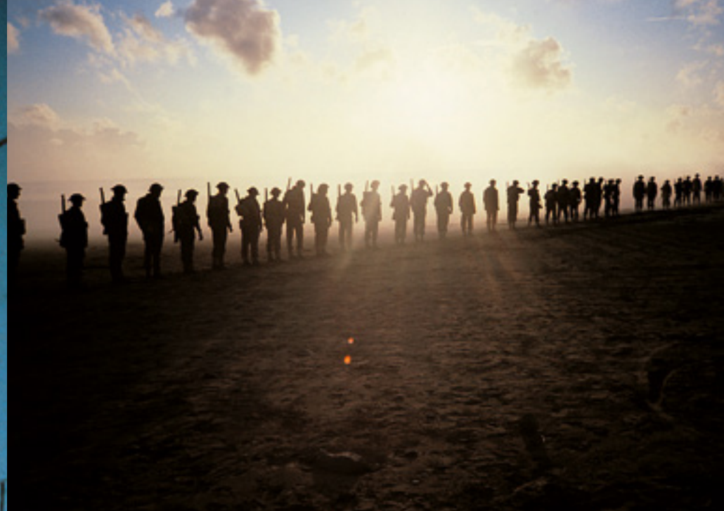
Aus dem Film The Wall : Soldaten in Saunton Sands (oben) und Bob Geldof als Pink.