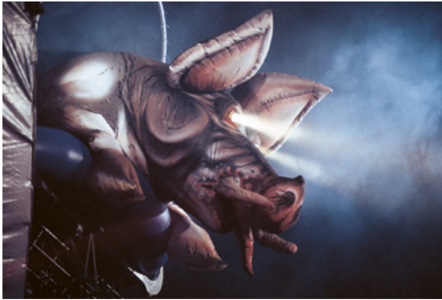
Division Bell -Tour 1994 – eines der Schweine kommt aus seinem Stall; die Spiegelkugel steigt auf und öffnet sich über dem Publikum.