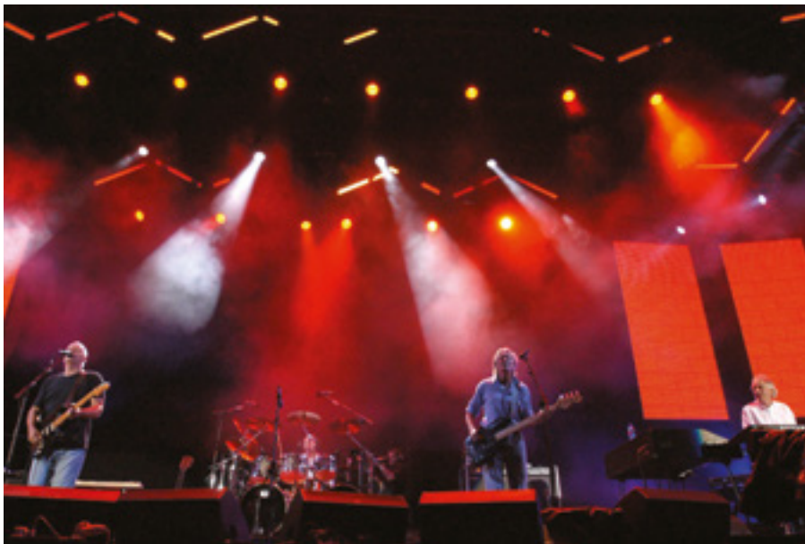
Die Band auf der Bühne bei Live 8.