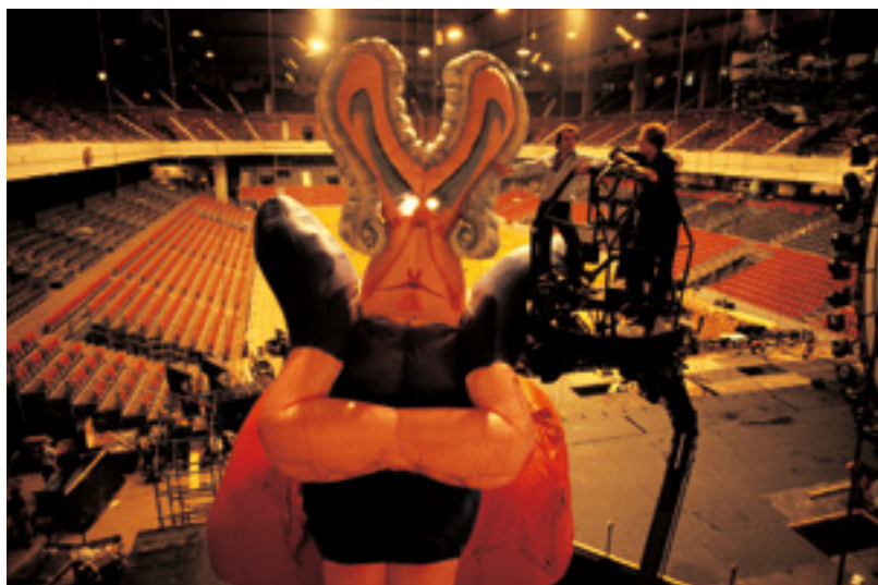
Gerald Scarfe (links) und Mark Fisher beim Aufstellen der »Mutter«, einer der aufblasbaren Figuren der Wall-Show .