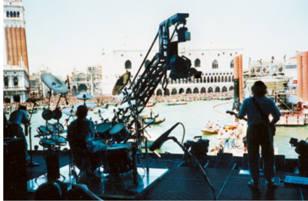
Auftritt in Venedig, 15. Juli 1989, im Meer vor der Piazza San Marco.