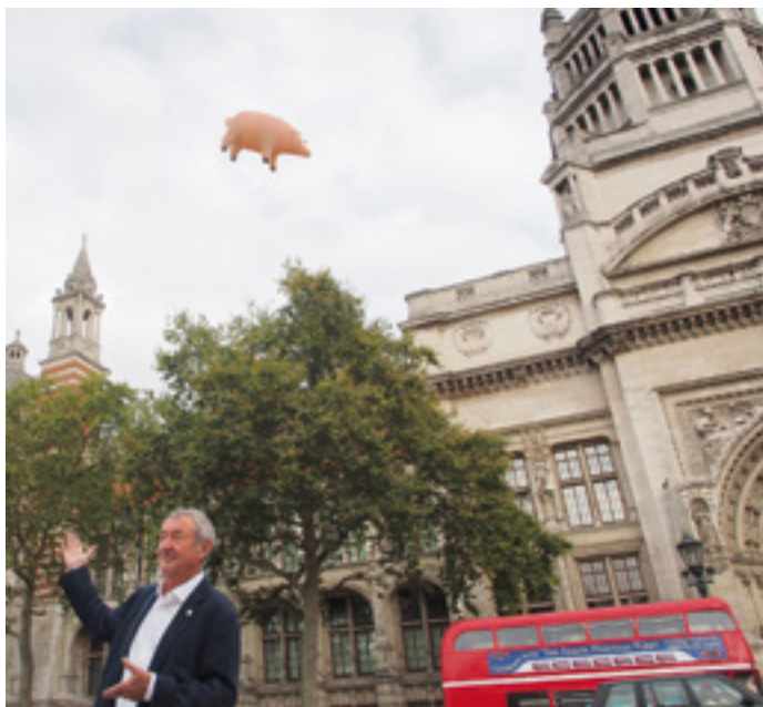
Beim Pressetermin zum Start der V&A-Ausstellung Their Mortal Remains im August 2016.