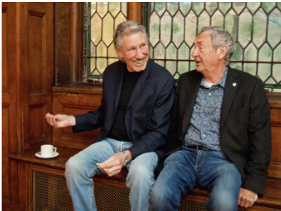
Ein Tässchen Tee mit Roger nach der Enthüllung der Pink-Floyd-Gedenktafel an der University of Westminster, Mai 2015.