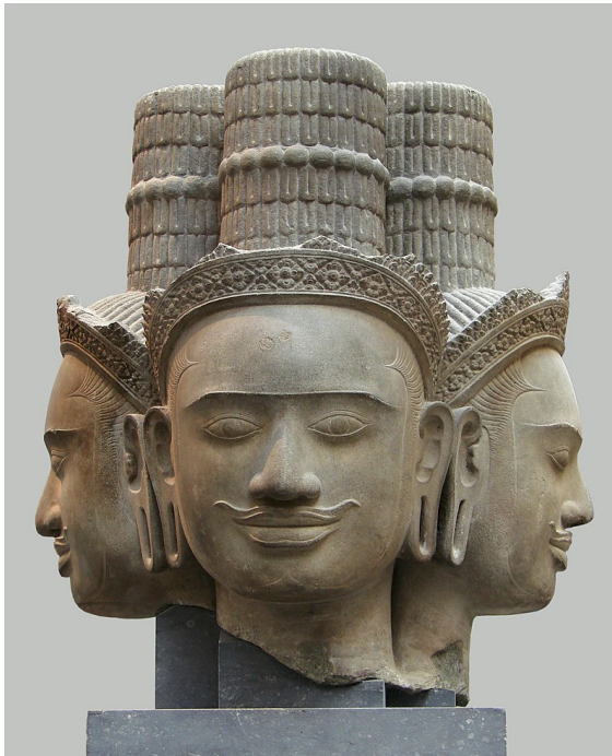
Schaubild 1: Vierköpfiger Brahma; Tempel von Phnom Bok, Kambodscha (9./10. Jahrhundert)

Sie geht für immer zurück. Wir müssen verstehen, dass die vedische Kosmologie ein zyklisches Zeitkonzept beinhaltet und die grundlegende Einheit dieser zyklischen Zeit der Kalpa ist oder der Tag von Brahma.