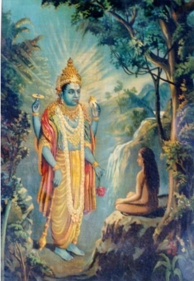
Vishnu erscheint vor Dhruva

Platz im Himmel anbot, der sogar über den Wohnorten der Götter lag.