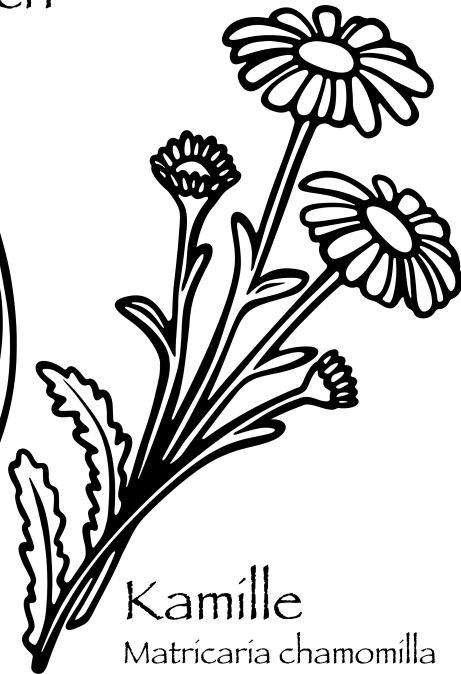
Kamille Matricaria chamomilla