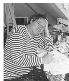
2012: NACHDENKEN ÜBER 30 JAHRE SPÄTER