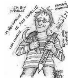
2015: VON ANSCHLÄGEN BETROFFEN

© VSA: VERLAG HAMBURG 2016, ST. GEORGS KIRCHHOF 6, 20099 HAMBURG © DER ZEICHNUNGEN: JARI BANAS [EHEMALS JARI PEKKA CUYPERS] 1980, 2012, 2016 ALLE RECHTE VORBEHALTEN DRUCK UND BUCHBINDEARBEITEN: CPI BOOKS GMBH, LECK ISBN 978-3-89965-715-9