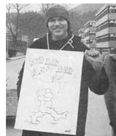
1976: IN DER KARL-MARX-STADT TRIER