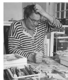
2016: MARX KOMMT IN KREFELD WIEDER