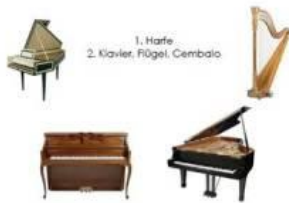
1. Harfe 2. Klavier, Flügel, Cembalo