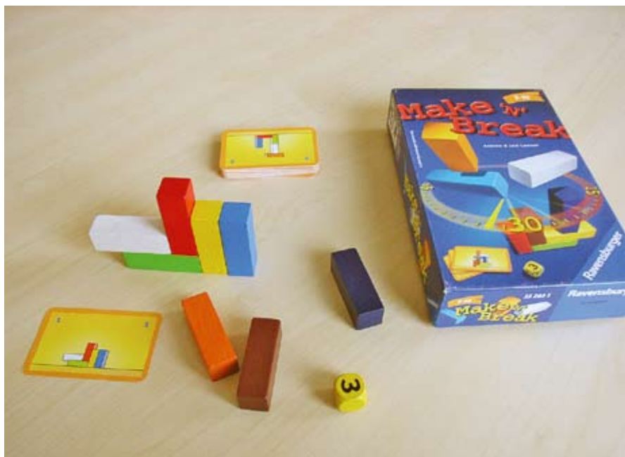
Make ,n‘ Break®