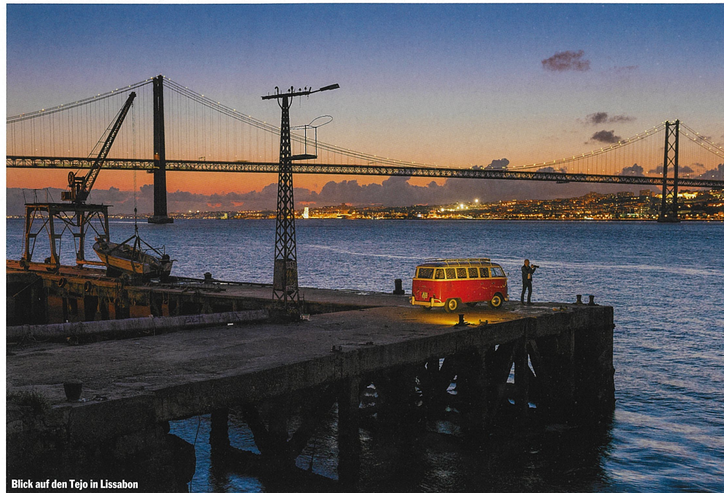
Blick auf den Tejo in Lissabon