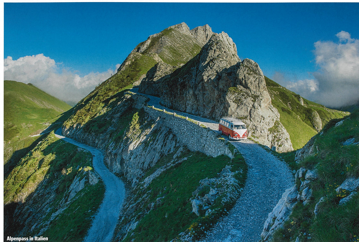
Alpenpass in Italien