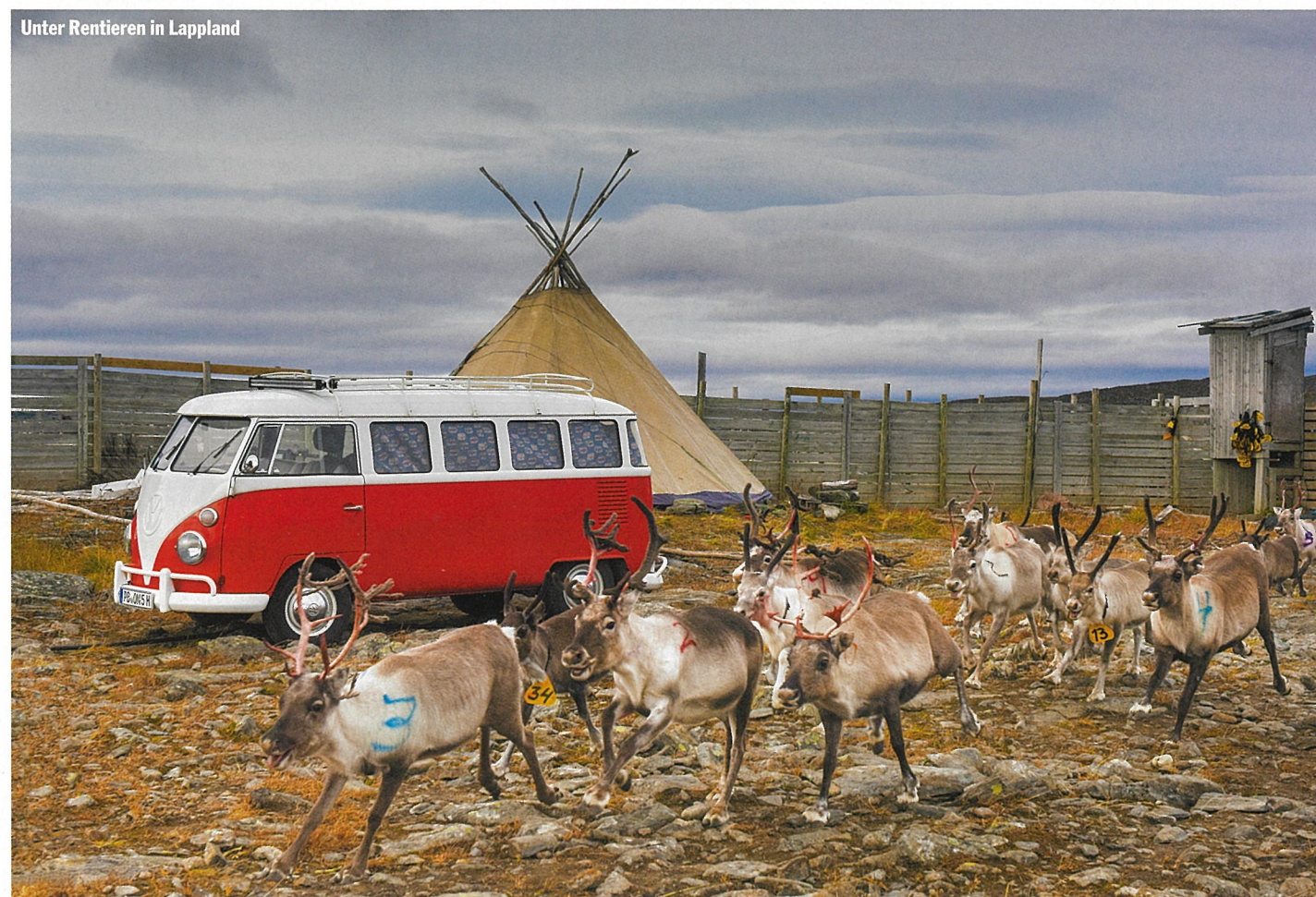
Unter Rentieren in Lappland