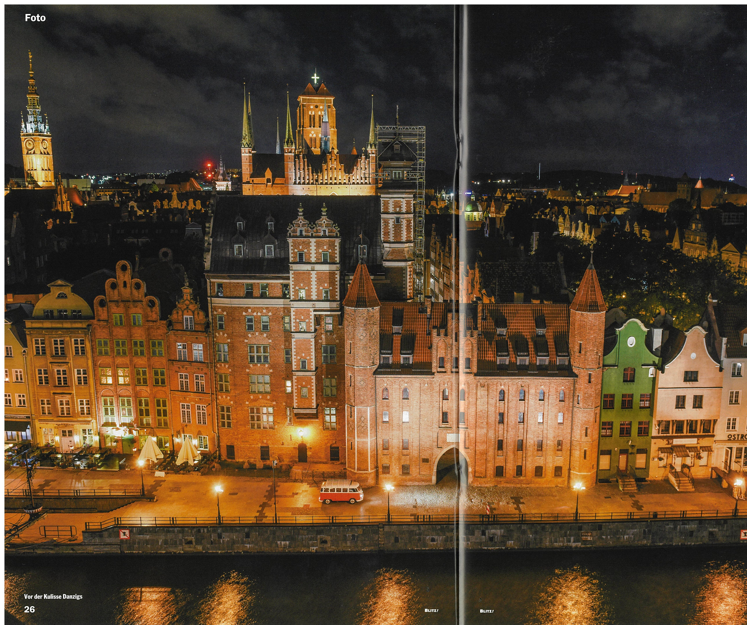
Vor der Kulisse Danzigs