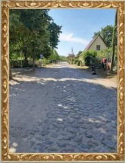
Dorfstraße in Vietmannsdorf

Drei Beispielfotos aus meiner Reise in die wunderschöne, beeindruckende Uckermark