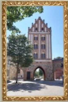
Berliner Tor in Templin (Stadtmauertor)

Drei Beispielfotos aus meiner Reise in die wunderschöne, beeindruckende Uckermark