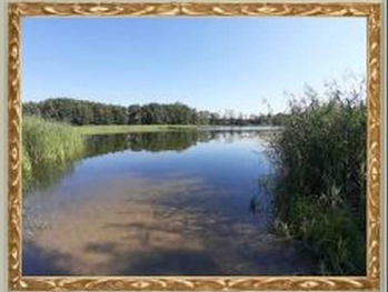
Polsensee bei Vietmannsdorf