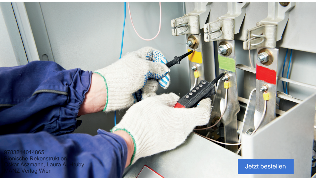
Abb. 2: Durch die Unachtsamkeit eines Kollegen stand der Anlagenteil der Baustelle, in dem Patrick arbeitete, unter Starkstrom.

Die Starkstromleitungen der gesamten Baustellenanlage wurden vor Arbeitsbeginn ausgeschaltet, damit Stromkabel verlegt werden konnten, was ohne Unterbrechung des Stroms lebensbedrohlich gewesen wäre. Patrick wollte im Zementwerk ein Kabel, das aus dem Boden kam, auf dicke Kupferschienen wickeln, die in die darüber liegende Etage führten. Um an die Kupferschienen zu gelangen, stieg Patrick auf eine Leiter, während sein Oberschenkel das Kabel streifte, das sich aus dem Boden emporschlängelte. Zwei Kilometer von der Baustelle entfernt hatte ein Kollege kurz davor den Schaltkreis jenes Anlagenteils, in dem Patrick gerade arbeitete, wieder eingeschaltet. Über dreißig Sekunden war er im Stromkreis gefangen, während 20.000 Volt durch seinen Leib zuckten.