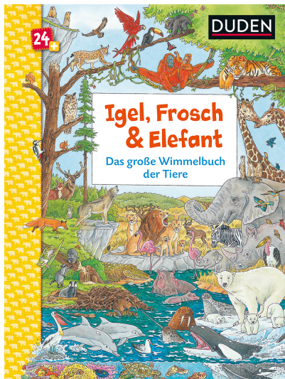
Abbildung des Produkts: