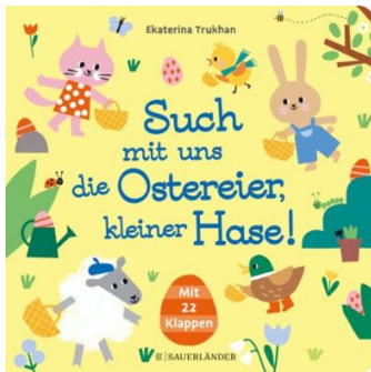
Abbildung des Produkts: