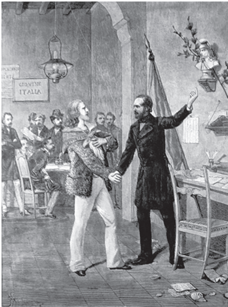
1833 trafen sich Mazzini und Garibaldi zum ersten Mal, und Garibaldi schloss sich dem Jungen Italien an.

Diese Städte waren bevorzugte Aufenthaltsorte Oppositioneller, die vor der Verfolgung geflohen waren, und es galt herauszufinden, mit wem sie sich trafen und was sie planten. Denn dass sie aktiv waren, stand außer Frage.