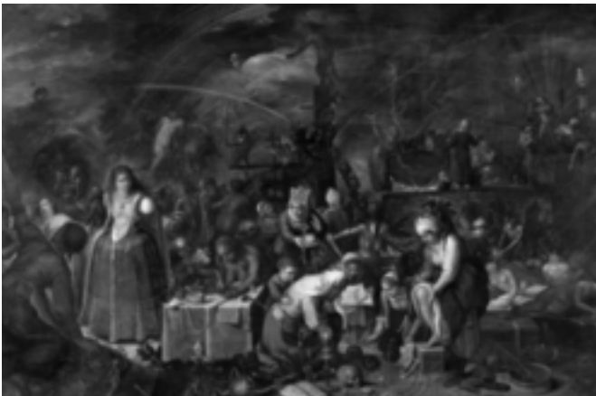
Versammlung: 1607 imaginierte Frans II. Francken einen Hexensabbat. Beängstigende Fabelwesen streifen umher, aber auch bürgerlich gekleidete Frauen nehmen teil.

Zu jener Zeit erlebte Leonberg beunruhigende Veränderungen. Weil das protestantische Württemberg 1608 die Führungsrolle im militärischen Bündnis der Protestanten übernommen hatte, stiegen die Abgaben der Bürger. Außerdem kam es 1608 und 1615 nach Missernten zu dramatischen Preissteigerungen. Der Winter 1615 war besonders streng gewesen, die städtische Armenhilfe musste fast die Hälfte der Leonberger Bevölkerung mit Getreide unterstützen. In dieser Zeit gab es in Leonberg die ersten Anklagen und Prozesse wegen Hexerei: Im Dezember 1615, vier Tage vor Weihnachten, schauten die Leonberger zu, wie vier Frauen aus dem benachbarten Heimsheim als Hexen hingerichtet wurden.