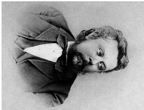
Musorgski in 1874