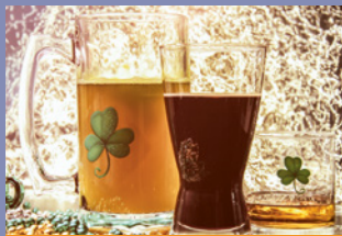
SEGEN & GEBETE