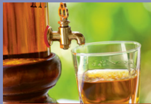
TRINKSPRÜCHE & SEGEN