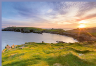
MORGENSEGEN & MORGENGEBETE