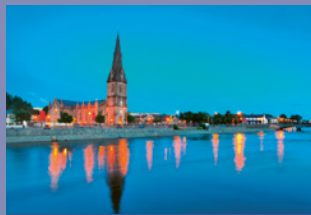
ABENDSEGEN & ABENDGEBETE