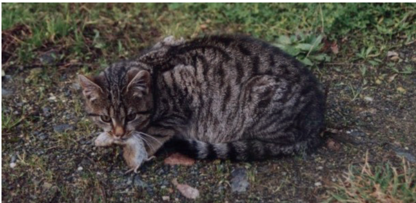
Mimmi mit Maus.