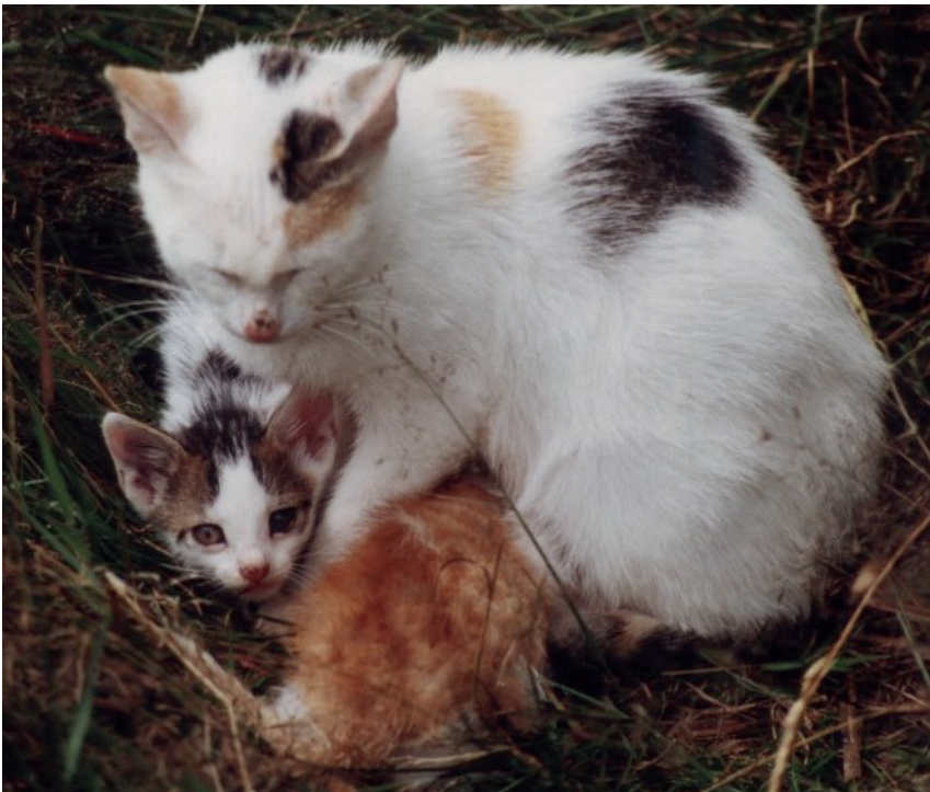
Butzi versorgte ihre viele Kleinen so gut es ging (hier eines, das morgens tot da lag).

Ich hatte, ohne von diesem Tod zu wissen, so langsam Panik. Das Glücksätzchen fehlte, zwei rot-weiß gefleckte musste ich begraben. Butzi umsorgte nur noch eines.