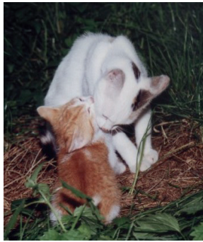
und putzt ihren Dori.