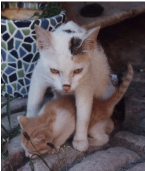
Butzi beschützt ...

Der rötlich-weiße Spross, der das große Sterben dieses dritten Wurfs auf dem Hof überlebte, wurde Dori getauft, eigentlich Dorian in Anlehnung an Dora, in Ableitung des Namens der Mutter meiner Frau. Dies, nachdem wir endlich herausgefunden hatten, dass es ein kleiner Kater war. Erst jetzt, nach dem ganzen Unglück, griffen wir wirklich ein. Seine Mama umsorgte ihn ohnehin beständig, denn sie musste jetzt ja keine vier Wusel im Zaum halten, sondern konnte sich auf ihn konzentrieren. Und auch wir wollten nicht auch noch ihn verlieren.