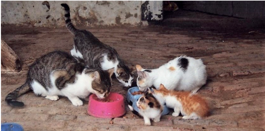
Von links nach rechts: Kini, Sophie, Butzi und zwei der Jungen von Butzi.

Ich habe die Katzen damals nicht systematisch dokumentiert. Da standen Bauprobleme im Vordergrund. Aber ein paar Bilder konnte ich nachträglich aus der Zeit doch finden. Neben den bereits benannten waren mit der Zeit auch die Kleinen von Butzi mit an den Futternapfen (siehe Bild unten).