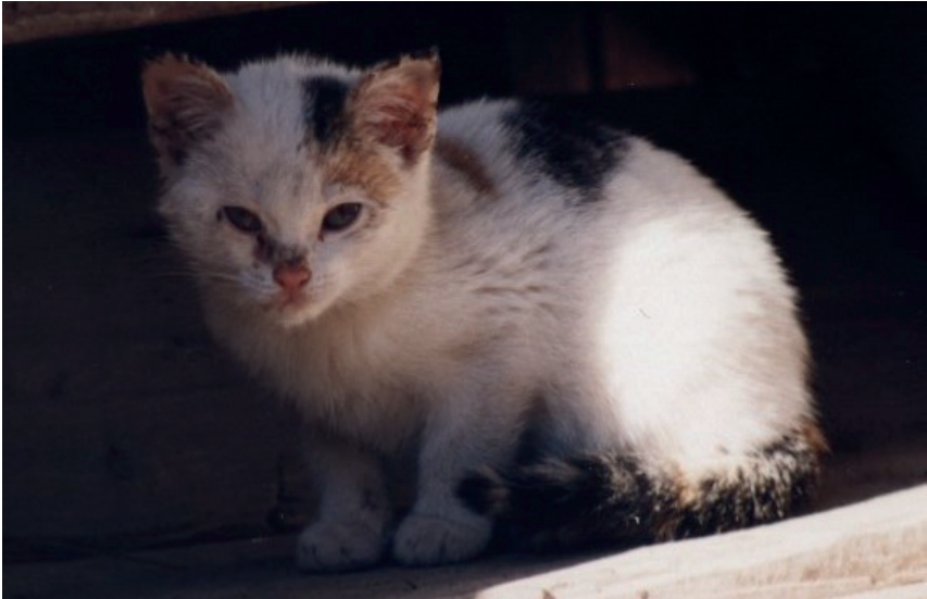
Ein besonders wildes von Butzis Jungen purzelte beständig aus dem Nest.

Ich habe die Katzen damals nicht systematisch dokumentiert. Da standen Bauprobleme im Vordergrund. Aber ein paar Bilder konnte ich nachträglich aus der Zeit doch finden. Neben den bereits benannten waren mit der Zeit auch die Kleinen von Butzi mit an den Futternapfen (siehe Bild unten).