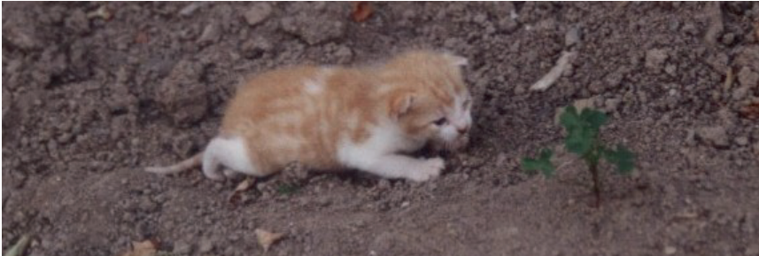
Dori – allein in einer fremden und gefährlichen Welt

Butzi konnte der Verlust ihrer drei Kinder nicht angelastet werden, denn sie war eine treusorgende, liebevolle Mutter. Sie hatte alles versucht, ihre Jungen gut zu verstecken, hatte mich als Fremdling zur Hilfe zugezogen und beschützte alle einzelnen fürsorglich. Natürlich war sie mit ihrem ersten Wurf überfordert, aber sie meisterte die Herausforderung mit ihren Möglichkeiten vorzüglich. Wir erlebten später, wie wenig sich andere Mütter um ihre Jungen kümmerten. Es war schon unserer fehlenden Voraussicht anzulasten, dass es so viel Tote gab. Ich kann uns nur damit entschuldigen, dass wir selbst wenig vor Ort waren, keine Ahnung von jungen Katzen hatten und uns diese Umstände der Renovierung unter Zeitdruck neben der eigentlichen Arbeit völlig überforderten.