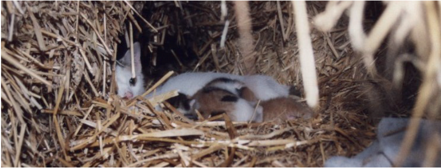
Butzi hatte sich ein Nest mit ihren Kindern eingerichtet.

Butzi war scheu, da im Umbruch aufgewachsen. Sie gebar vier Kinder und versteckte sie. Wir bekamen deren Existenz erst mit, als sie eines Tages laut schreiend vor mir stand, was nicht ihre Art war. Sie wollte mich auf etwas aufmerksam machen. Ich verstand nicht. Es war kein Hunger, es war kein Durst. Sie wollte mir offensichtlich etwas zeigen. Ich sollte mitgehen. Also folgte ich ihr. Sie führte mich in unsere große Scheune. Dort lag viel Heu auf verschiedenen Ebenen. Ich entdeckte, indem ich ihr in das obere Stockwerk folgte, ein Geheimnis. Die Katzen hatten sich in dem Heu verzweigte Gänge angelegt und Lager eingerichtet.