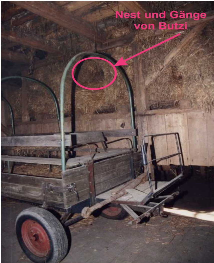
Der Eingang zu einem Labyrinth.

Völlig perplex war ich, weil Butzi mich geholt hatte und mir den Ort zeigte. Offensichtlich war ihre Verzweiflung so groß, dass sie sogar wenig vertraute Lebewesen wie mich einband, damit sie ihr in ihrer Not helfen. Etwas verwirrt war ich dann schon, dass die Jungen von Butzi nun jeden Tag mehrmals herunterpurzelten und von mir hinaufgesetzt werden mussten und dennoch keinen Schaden nahmen. Ich schaute jeden Tag mehrmals nach und fand jeweils eines der Kleinen, die auf die Zwischenebene eines dort stehenden Karrens gefallen waren oder ganz nach unten. Und sie waren vergnügt und wurden fröhlich von den oben wartenden Geschwistern erwartet. Es sah so aus, wie wenn das zu einem Spiel geworden war.