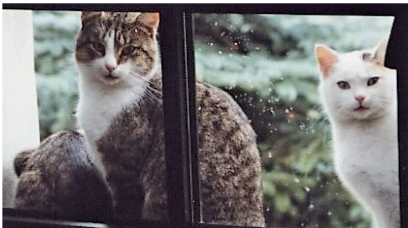
Kini und Butzi am Fenster, links daneben Sophie.

Eines Tages besah ich mir unsere „Sissi“ von hinten und musste bemerken, dass sie enorme Eier ausgebildet hatte. Das war kein Mädchen. Das war ein Kater, auch wenn er – und das ohne Kastration – alle Verhaltensmerkmale eines Mädchens aufwies. Aus der ursprünglichen Sissi wurde also der Kini. Er war zurückhaltend gegenüber den Geschwistern und scheu uns gegenüber. Er konnte nie festgehalten oder hochgehoben werden. Eine Sterilisation war somit außerhalb der Möglichkeit. Vermutlich hatte er als potenter Kater Einfluss auf den weiteren Zuwachs um und auf dem Hof.