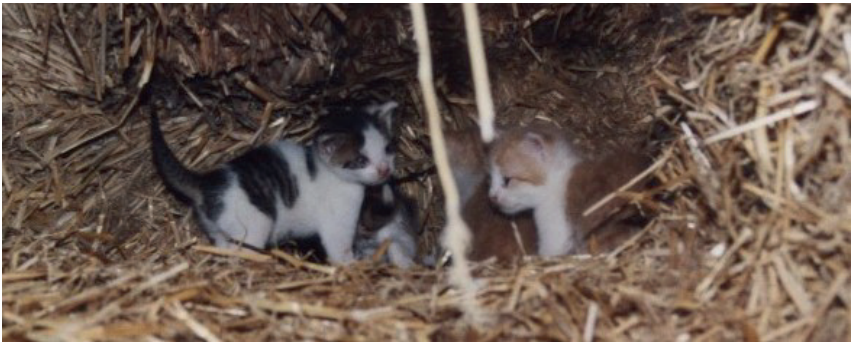
Dort hatten ihre Kinder fantastische Spielmöglichkeiten.

Sie wollte mir zeigen, dass eines ihrer Jungen aus diesem Nestausgang und mehr als zwei Meter heruntergefallen war. Ein unglaublich schönes, gerade mal zehn bis fünfzehn Zentimeter langes Wesen, zudem ein „Glückskätzchen“. So nennt man dreifarbige Katzen. Diese sind immer weiblich. Die Kleine, die sie mir zeigte, war rot, weiß und schwarz gemustert. Und sie war zutraulich. Ich konnte sie also in die Hand nehmen, auf den Wagen steigen und sie wieder ganz oben in den Ausgang des Nestes setzen, wo schon alle drei anderen standen und auf ihr Geschwisterchen wartete. Alle waren sehr schöne kleine Wesen, entweder rötlich-weiß gemischte oder grau-weiß gefleckte Kitten. Na ja, bei der Mutter!