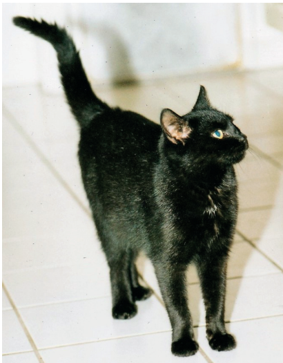
Momo und ich vor 25 Jahren.

Momo war also im Nachbarhaus angekommen. Sie aß und schlief dort zusammen mit Barry, einem schwarzen Kater, mit dem sie wie mit einem Bruder verbunden war. Irgendwie passte ihr aber etwas nicht an ihrem Heim oder sie rechnete unser Nachbarhaus mit Garten – und insbesondere mich – zu ihrem Heim dazu. Meine Frau und ich suchten ihre Anhänglichkeit zu ergründen und erfuhren folgendes zu ihrer Geschichte: Jemand hatte sie in einer Mülltonne gefunden und ins Tierheim gebracht. Unser Nachbar wollte seine Frau trösten, die ihren schwarzen Kater verloren hatte und holte sie als Geschenk für sie ab. Doch seine Frau trauerte noch um ihren Kater und konnte das neue Wesen nicht als Ersatz akzeptieren, eigentlich gar nicht annehmen. Es war nicht ihr Kater. Damit konnte sich Momo auch nicht angenommen fühlen. Raus aus dem Tierheim war ja gut. Freigängerin zu sein, ganz prima. Aber sie schaute sich dann nach neuen Möglichkeiten um.