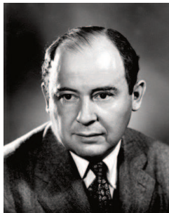
1. John von Neumann, Computerpionier (1903-1957)