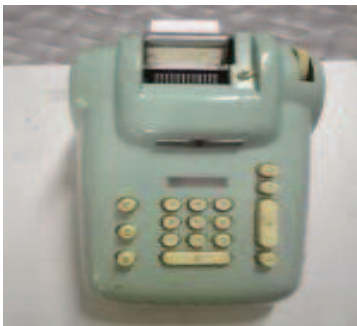
6. Burroughs Ten-Keys Tischrechner