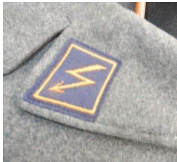
5. Fliegerübermittlungstruppen Batch