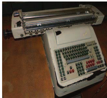
7. Mechanische Buchungsmaschine