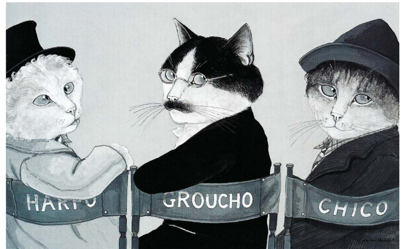
OBEN Die Marx Brothers in SKANDAL IN DER OPER (1935) RECHTE SEITE Charlie Chaplin und Jackie Coogan in THE KID (1921)