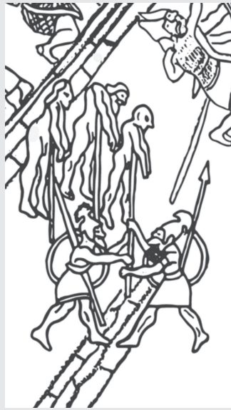
Abb. 1: Pfählung

Die Zeichnung stellt einen Ausschnitt aus einer größeren Komposition dar, die die Einnahme einer Stadt und die daraus folgenden Konsequenzen für die Bewohnerschaft zeigt. Die Körper der Besiegten werden nackt zur Schau gestellt. Nicht zu erkennen ist, ob die Hinrichtung durch Pfählung erfolgt ist oder ob die Leichname der zuvor Getöteten zur Schau gestellt werden. Bei den sonstigen Darstellungen der Behandlung von Gegnern fällt auf, mit welcher unverhohlenen Grausamkeit diese repräsentiert werden. Die Szene erinnert an 2Sam 4,12 und an den Tod von Saul und seinen Söhnen in 1Sam 31,10: »...aber seinen Leichnam hängten sie auf an der Mauer von Bet-Schean.« Die Zurschaustellung der Leichname der getöteten Feinde ist zugleich Schmähung und Grabverweigerung (vgl. auch 2Sam 21,7-14). Die Vernichtung des Gegners ist damit komplettiert.