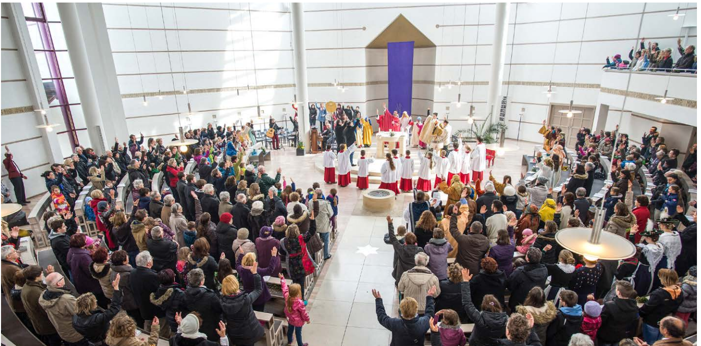
Versammelt um den Herrn: Liturgie ist kein Angebot, das Hauptamtliche machen , sondern eine Aufgabe aller Getauften.

Besonders in den Gottesdiensten, an denen eine größere Zahl nicht regelmäßig mitfeiernder und liturgisch nicht eingeweihter Menschen teilnimmt, die man in besonderer Weise als Gäste bezeichnen kann (vor allem bei Kasualgottesdiensten wie Taufe, Hochzeit, Begräbnis), ist eine Gruppe von Menschen notwendig, die die Feier durch ihr Beten und Singen als Träger des Gottesdienstes überhaupt erst ermöglichen. Vor allem aus dieser Gruppe werden Menschen bereit sein, Dienste in der Liturgie zu übernehmen; ihre Zurüstung für diese Dienste und ihre weitere Begleitung ist eine große Chance für die Steigerung der Qualität des Gottesdienstes. Im Zusammenspiel aller Feiernden in ihrer jeweiligen Rolle, aus Worten, Zeichen und Handlungen, entsteht ein heiliges Spiel, in dem Raum für die Begegnung mit Gott eröffnet und damit die Kirche zum Ereignis wird.