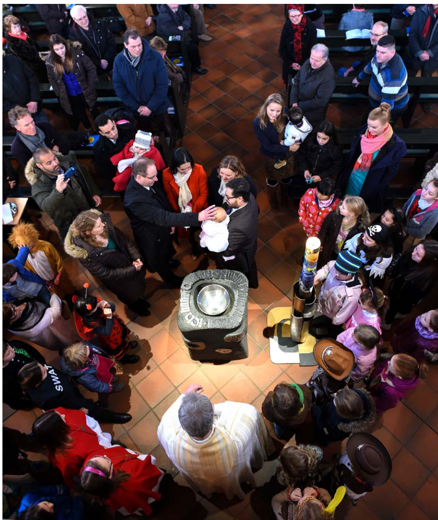
Atmosphäre der Zugehörigkeit: Ein Kind wird im Rahmen der sonntäglichen Gemeindemesse getauft.

Noch mehr als vor der Corona-Pandemie sind viele Sonntagsgottesdienstgemeinden eine Versammlung grauer und weißer Häupter geworden. Es sind vor allem Ältere, die nicht nur kommen, weil sie es von Kindheit und Jugend an so gewohnt sind,