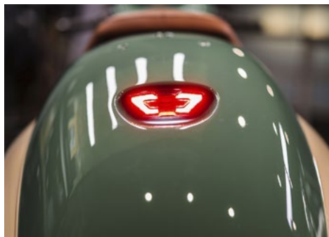
Rot: Auch mit originaler Beleuchtung könnte die Zulassung schwierig werden