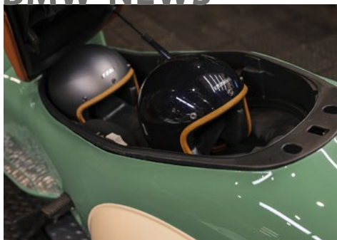
Große Klappe: Das Helmloch bleibt funktional und beim Abstellen erweiterbar