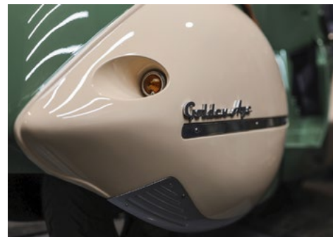
Heckflosse: Neben der Verkleidung sind die Chromleisten Teil des Umbau-Kits