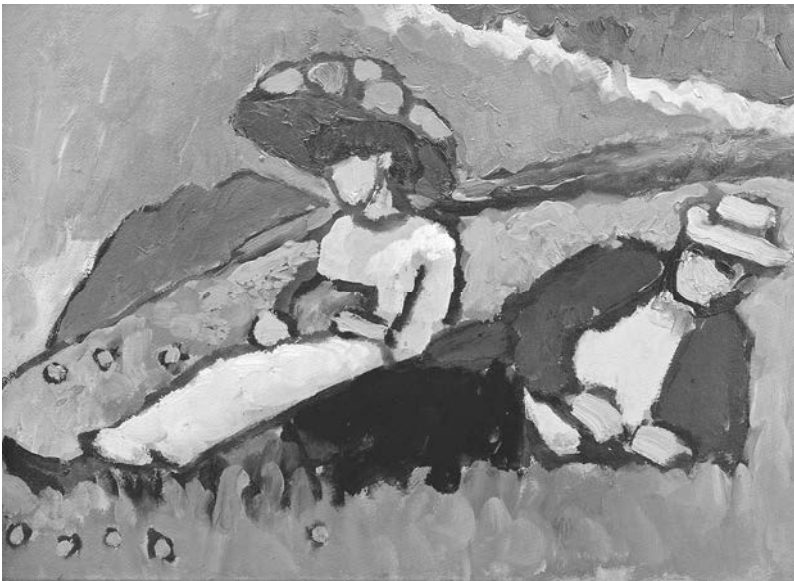
Gabriele Münter: Jawlensky und Werefkin, 1909, Öl auf Pappe, 32,7 × 44,5 cm