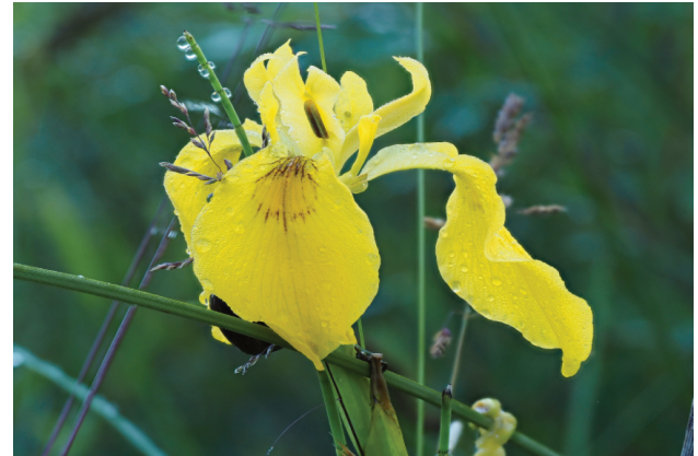
Sumpf-Schwertlilie am Moorweiher ⑥ EM1 MIII, 60mm, f5.6, 1/100s, Festbrennweite, ISO 200