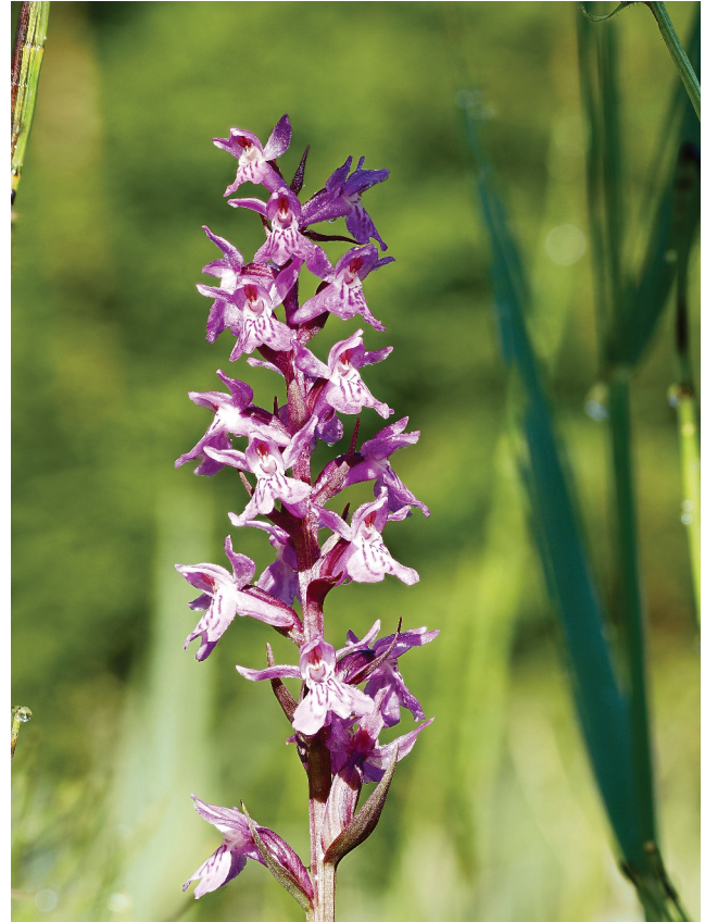
Knabenkraut im Sonnenschein ⑦ EM1 MIII, 60mm, f5.6, 1/100s, ISO 200