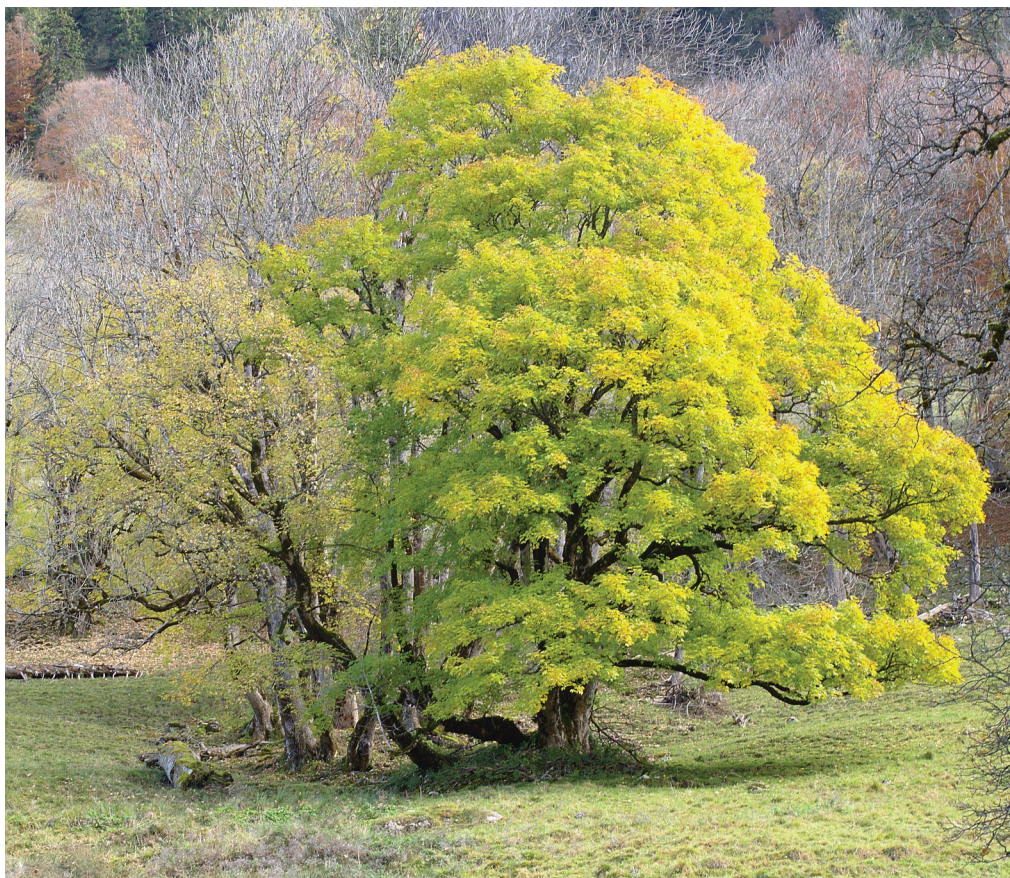
Herbst im Dietersbachtal EM1, 12-40mm, f13, 22mm, ISO 200