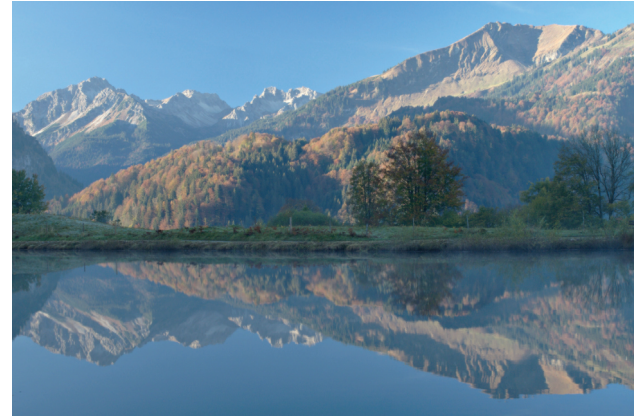
Moorweiher in Pastelltönen ⑤ EM5 MII, 12-40mm, 25mm, f11, 1/10s, ISO 200