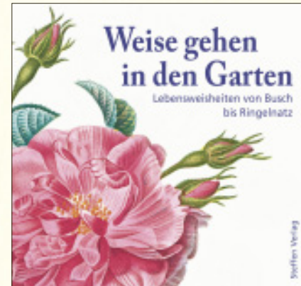
Illustrationen Privatsammlung Hugh Dean Emerson, London