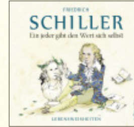
Illustriert von Jutta Mirtschin