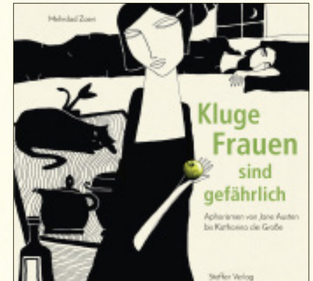
Illustriert von Mehrdad Zaeri

Alle Bände dieser Reihe unter www.steffen-verlag.de/lebensweisheiten