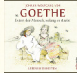
Illustriert von Jutta Mirtschin