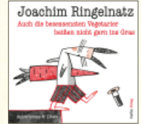
Illustriert von Harald Larisch