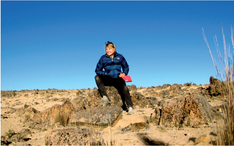
Die Autorin Meg Lukens Noonan in den peruanischen Anden auf den Spuren der sagenumwobenen Vikunjas .