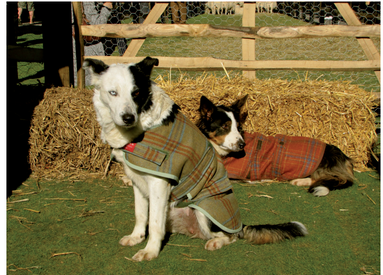
Auch die Schäferhunde werden von den altherwürdigen Schneidereien HUNTSMAN und ANDERSON & SHEPPARD mit maßgeschneiderter Bekleidung aus englischen Wollstoffen ausgestattet.