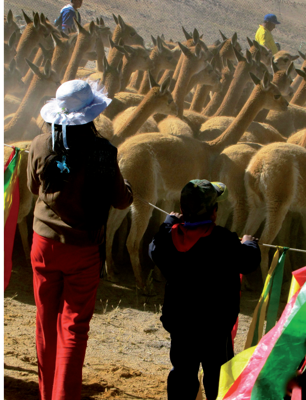
Während des Chaccus stehen die Bewohner der Gemeinde in einer langen Reihe und treiben mit einem langen, mit farbigen Fähnchen geschmückten Seil die Tiere vorwärts.