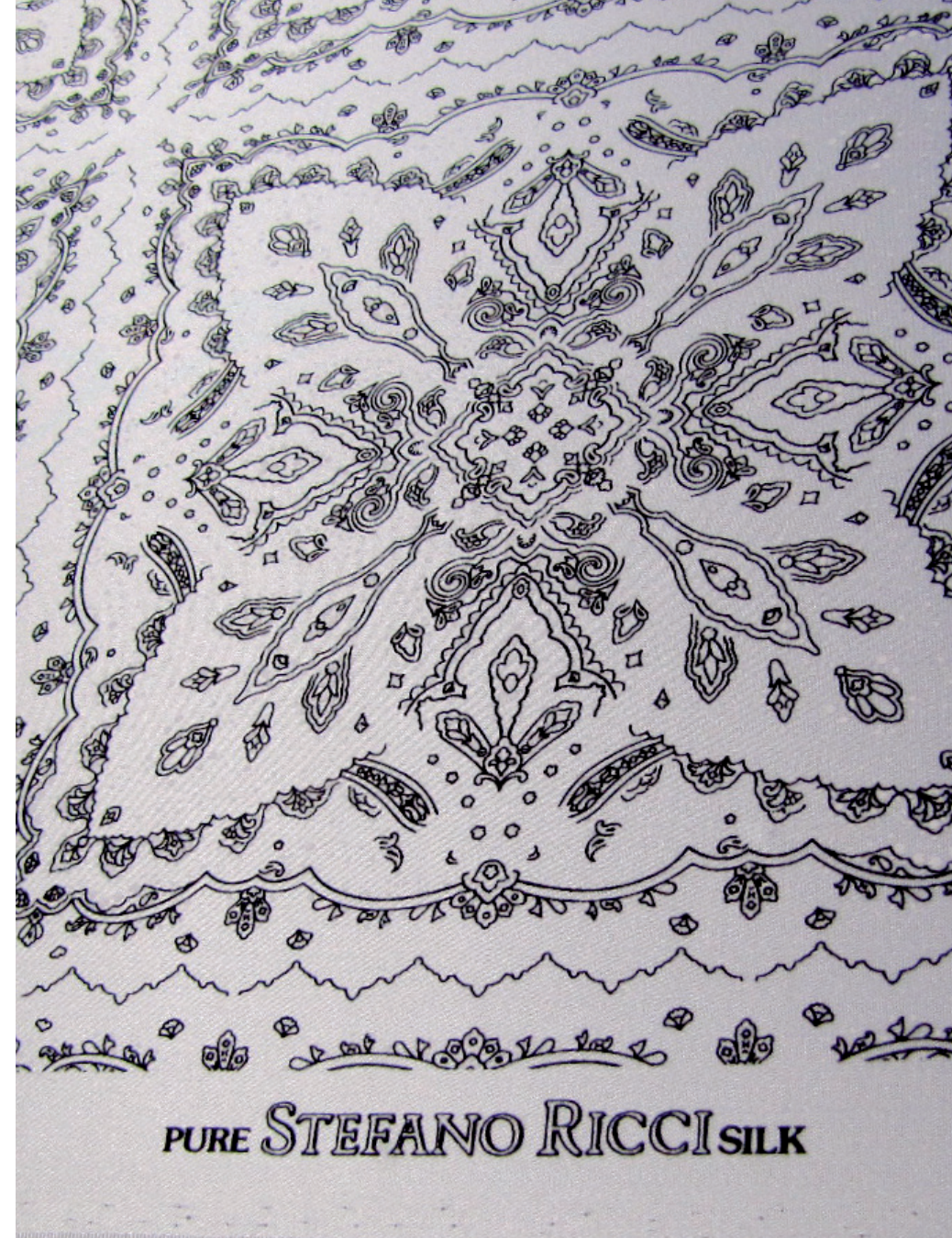
Die Anfänge eines Seidenstoffes von STEFANO RICCI .