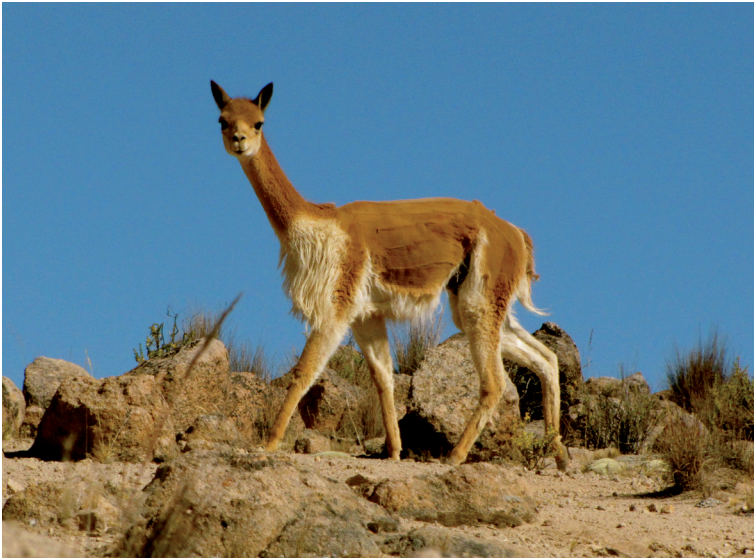
Ein geschorenes Vikunja . Die edlen Tiere liefern pro Schur deutlich weniger als fünfhundert Gramm Wolle und ihr Haar wächst mit etwa zweieinhalb Zentimetern pro Jahr nur sehr langsam nach.