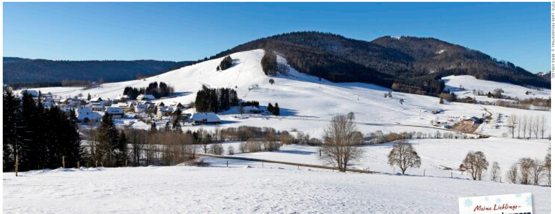
Endlich durchatmen: Blick über das Albthal zum Sportzentrum von Bernau und den Spitzenberg

In Bernau Dorf gibt es nahe dem Winterwanderweg Nr. 17 einen kleinen Parkplatz. Dieser wird auch als Ausgangspunkt genannt. Sobald es schneit und die Räumfahrzeuge an die Arbeit gehen, werden jedoch die ohnehin nur wenigen Stellplätze rasch zugeschoben. Kurzum: Da wir drei Winterwanderwege zu einer Runde kombinieren, starten wir beim Sportzentrum Spitzenberg.