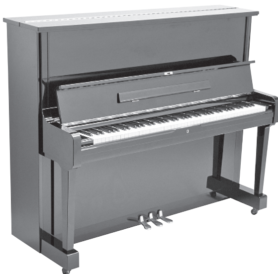
Abbildung 1.2: Aufrecht steht das Klavier