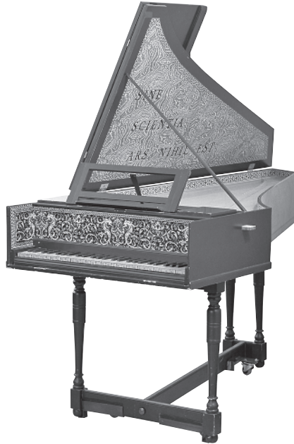
Abbildung 1.4: Ein prächtig verziertes Cembalo

Wenn Sie zufällig einmal ein Cembalo finden – vielleicht in einem Museum –, dann werden Sie bemerken, dass Cembali wie Flügel aussehen (siehe Abbildung 1.4). Achten Sie jedoch auf den reichverzierten Deckel des Cembalos. Heute müssen Tastenmusiker mit ganz einfachen schwarzen Kisten auskommen.