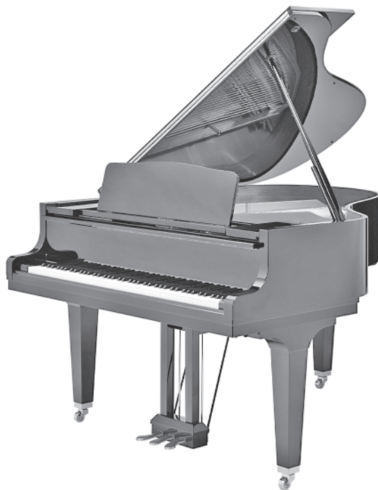
Abbildung 1.1: So einen zu besitzen, ist riesig.

♪ Der Stutzflügel: Das ist ganz einfach eine kleinere Version des großen Flügels. Der typische Stutzflügel (auch Mignonflügel genannt, von französisch mignon = niedlich) ist nicht größer als einen Meter achtzig.