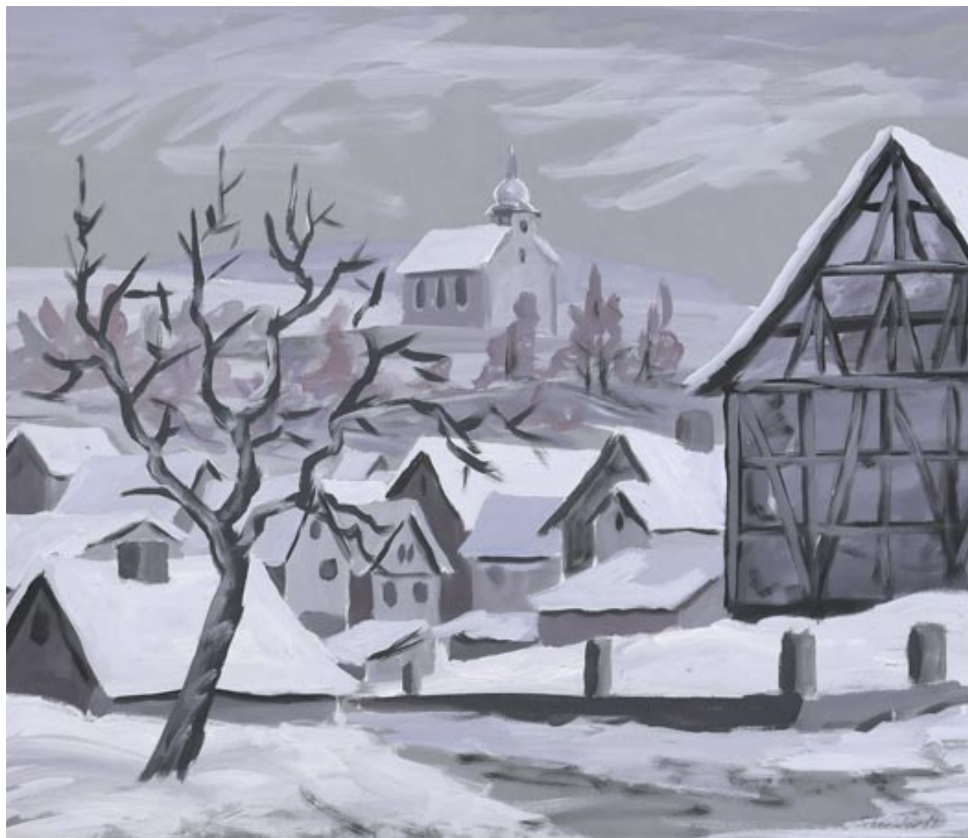
Oberwaldbehrungen | Tempera