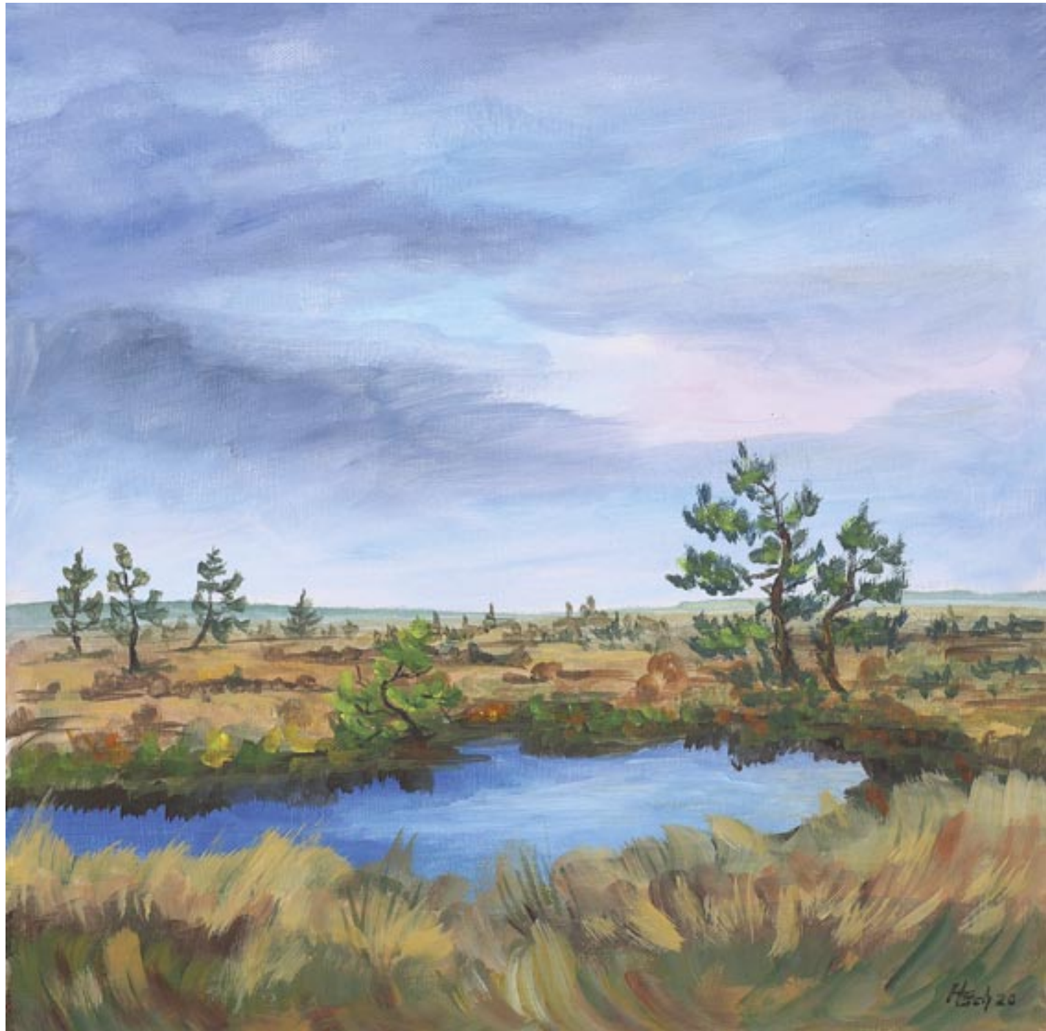
Moorauge | Acryl