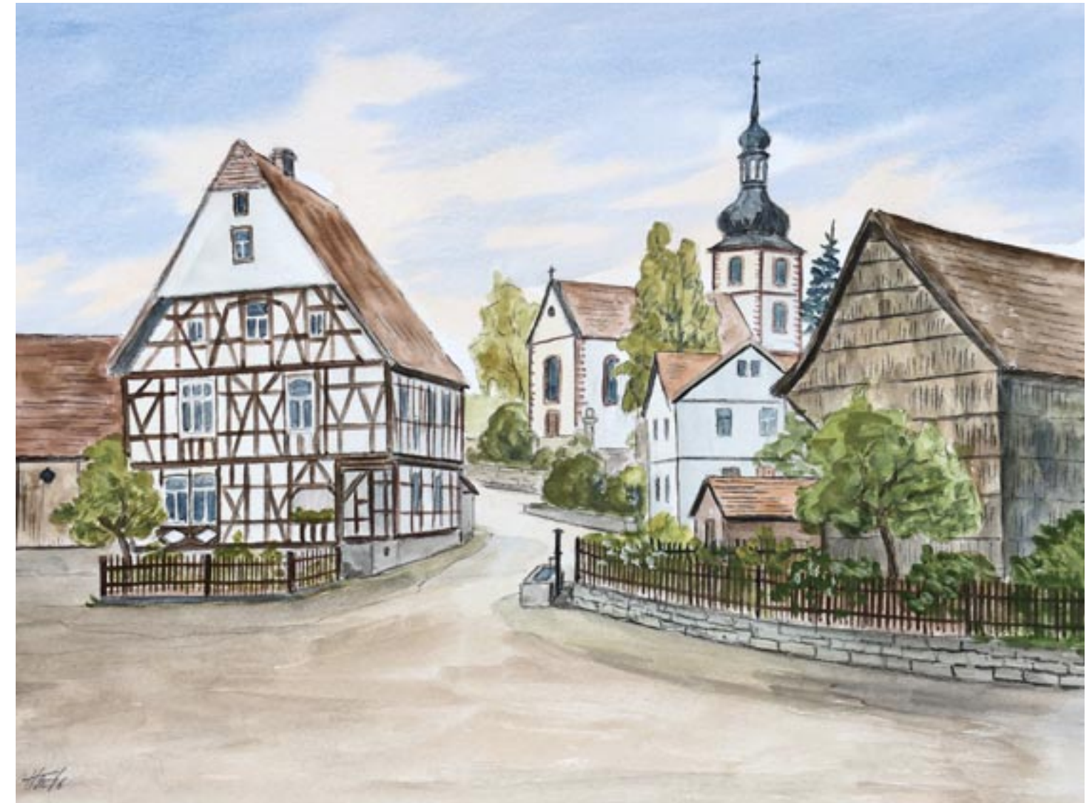
Schmalnau und Milseburghütte | Aquarell-Zeichnung