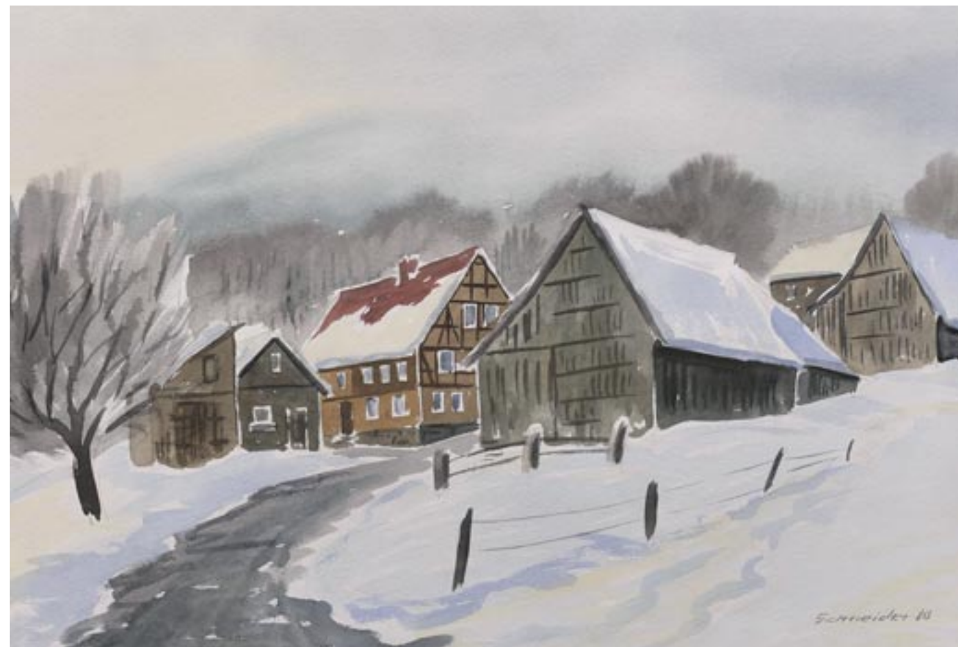
Rhöngenhöfte | Tempera