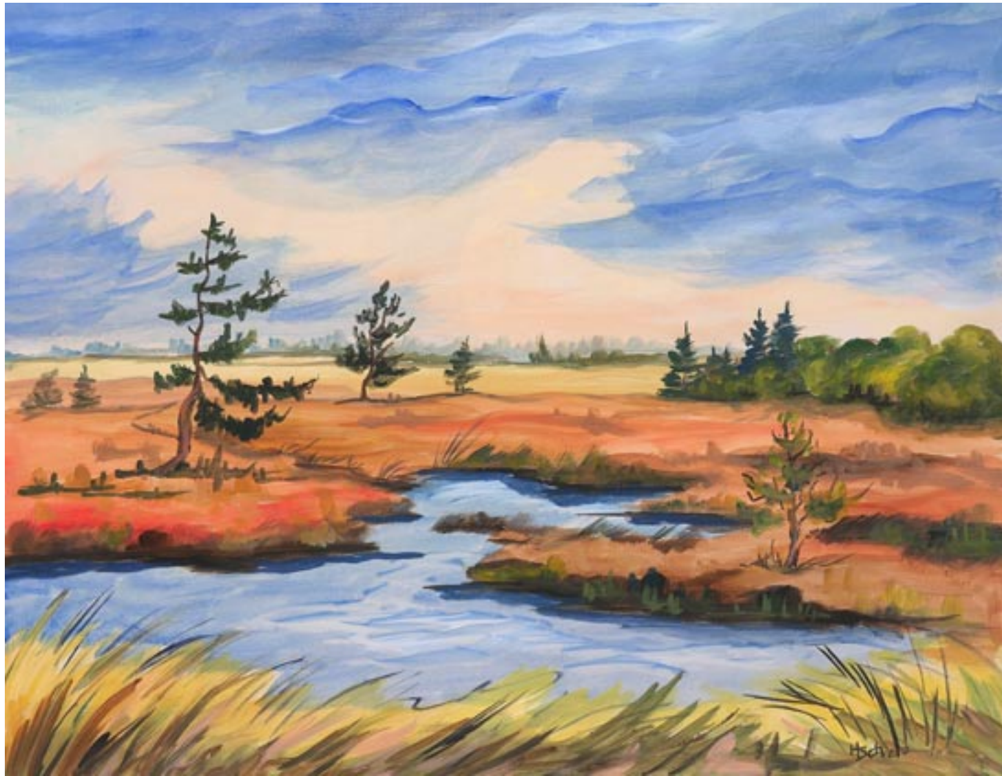
Im Schwarzen Moor | Acryl An der Schwedenschanze | Acryl