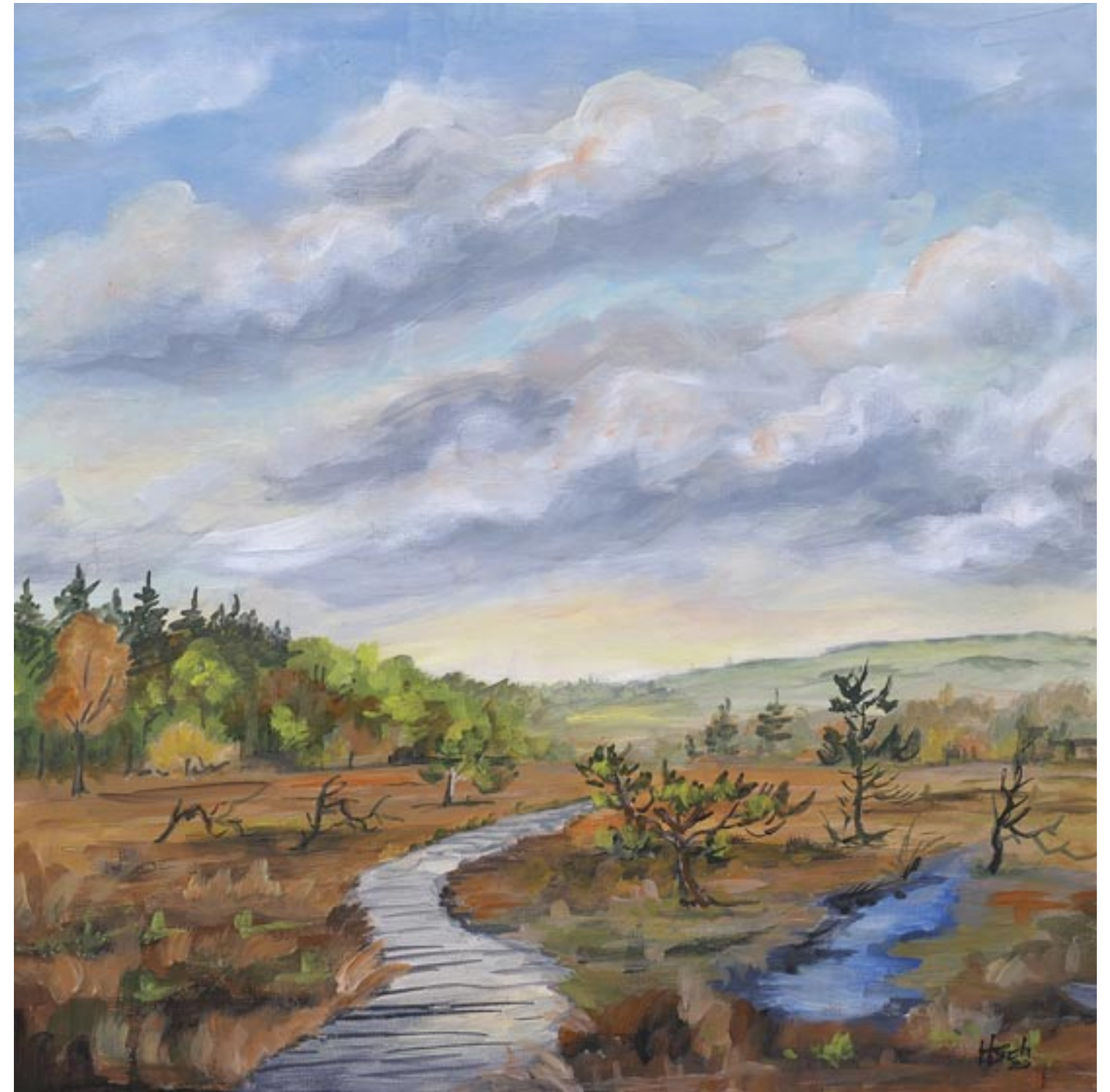
Weg ins Moor | Acryl