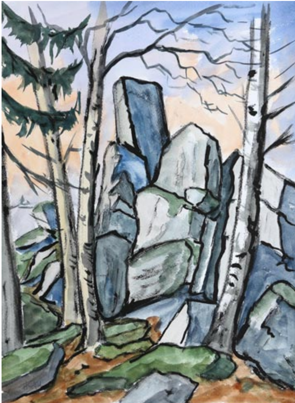
Naturdenkmal Steinwand | Acryl