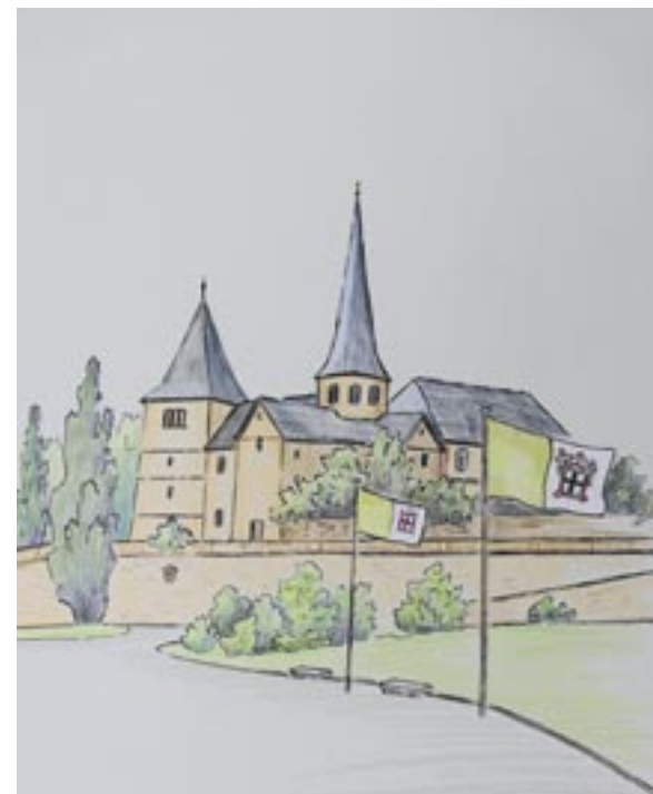
Dom und Michaelskirche | Aquarell Michaelskirche | Zeichnung