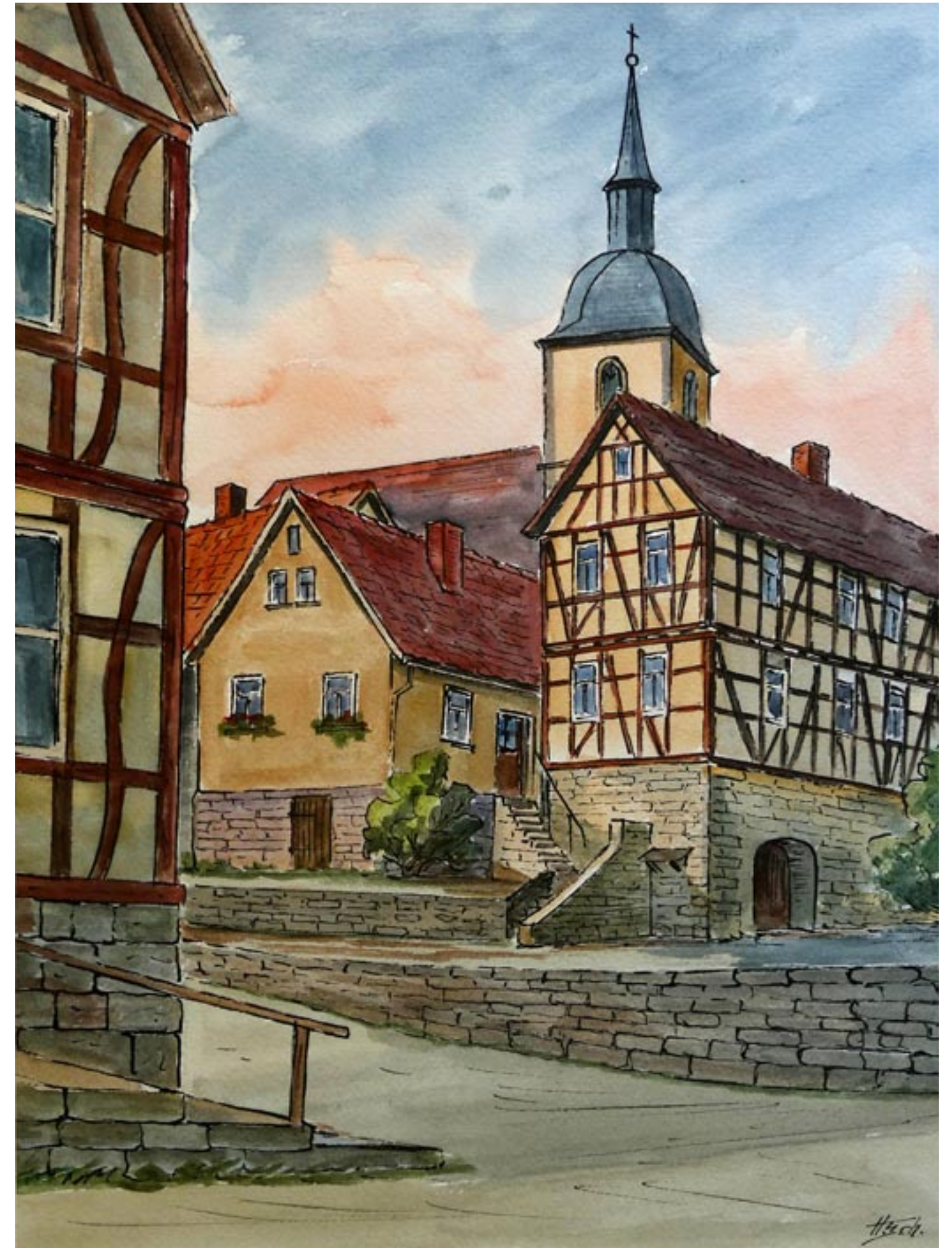
Nordheim | Gouache und Sondernau | Tempera Das alte Haselbach | Aquarellzeichnung