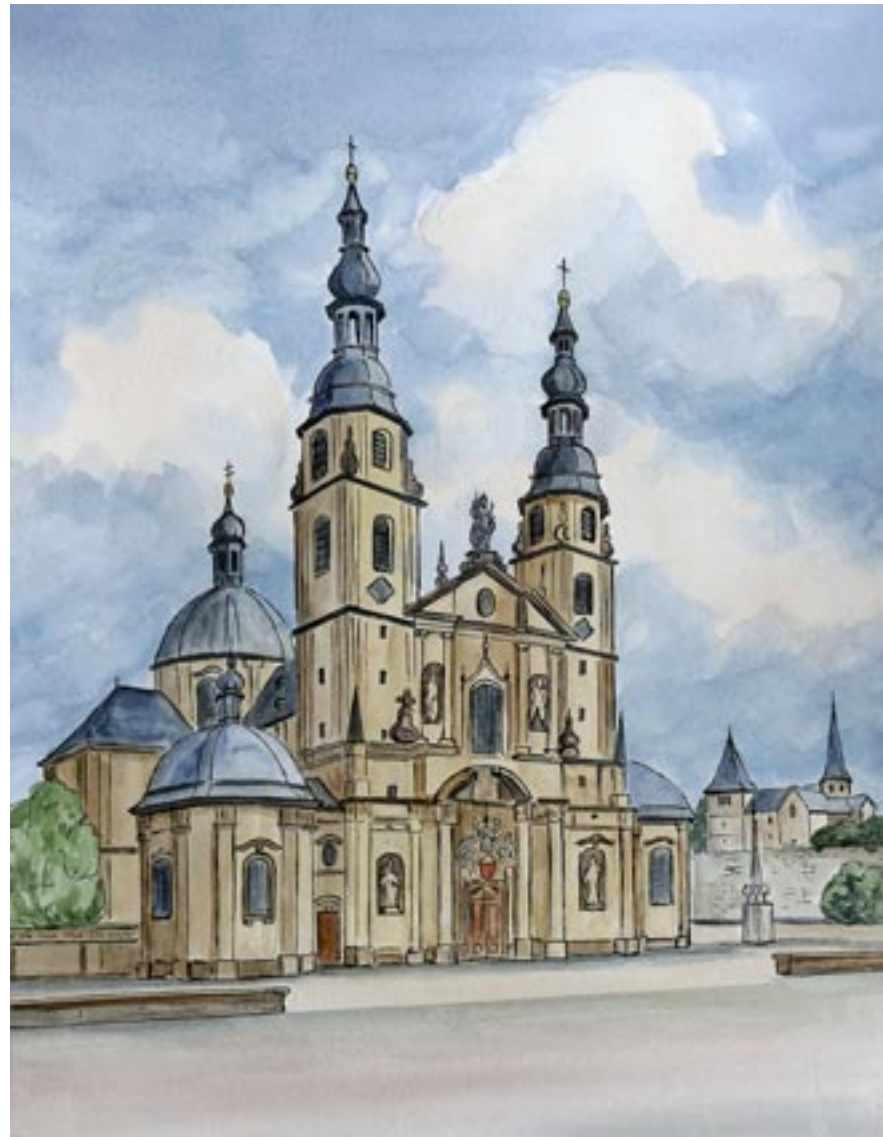
Fulda Dom | Aquarell