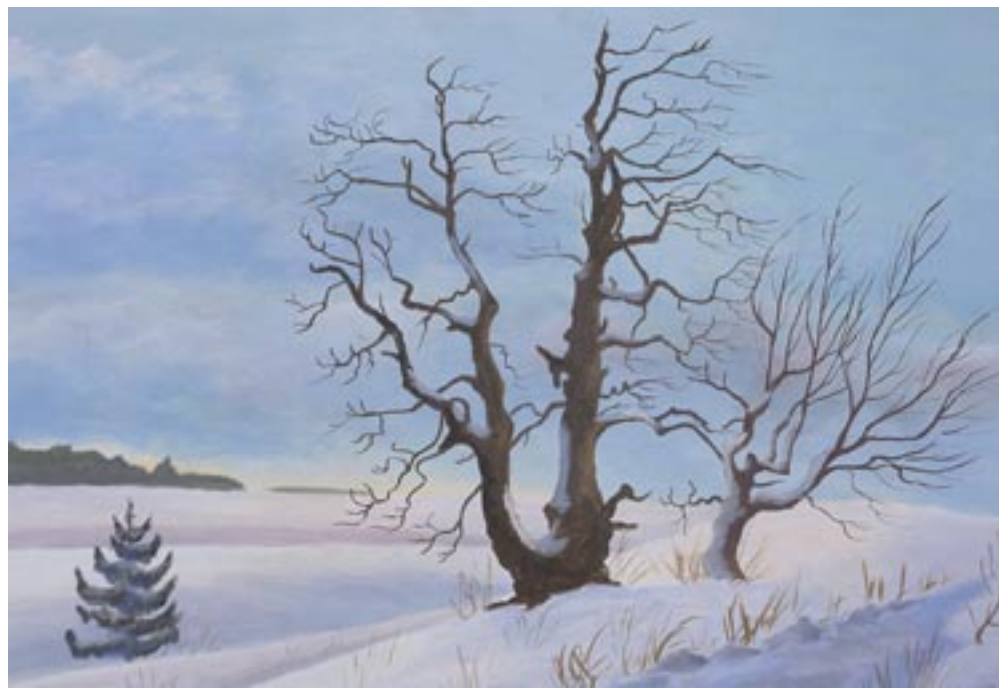
Eube | Tempera Am Eisgraben | Gouache