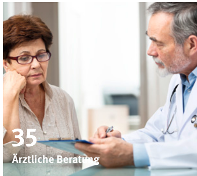
35 Ärztliche Beratung