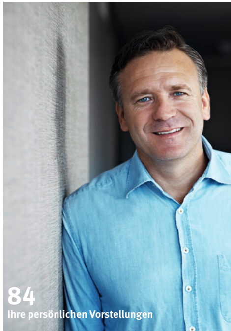
84 Ihre persönlichen Vorstellungen