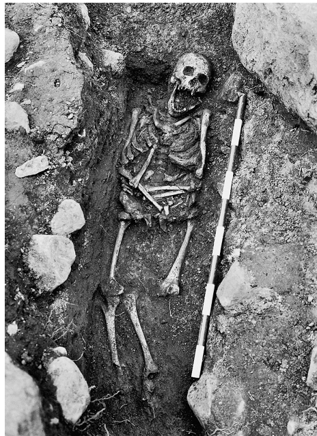
Kleinwüchsiger auf dem Gräberfeld von Tierp.

Ein weiteres Indiz dafür, dass die Gesellschaft der Wikinger sich um die Jüngsten und Ältesten, um kranke und behinderte Mitglieder kümmerte, sind die drei Kleinwüchsigen aus zwei Gräberfeldern der Wikingerzeit im heutigen Schweden. Sie wurden krank geboren. In zwei Fällen handelt es sich um Spondyloepiphysäre Dysplasie. Das ist eine erblich bedingte Erkrankung, die das Knochenwachstum beeinträchtigt. Sie führt zu Kleinwuchs, Missbildungen und Verformungen der Wirbelsäule und Gelenke. Zudem kann sie die Lunge, Augen und Zähne beeinträchtigen, zuweilen auch das Gehör. Die Krankheit wird autosomal-dominant vererbt. Leidet also ein Elternteil an der Erkrankung, sind auch 50 Prozent der Kinder betroffen. Bemerkenswert ist, dass zwei der Kleinwüchsigen auf demselben