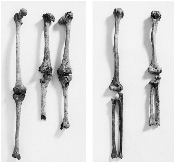
Arme und Beine des Kleinwüchsigen waren deutlich kürzer als normal und die Hüftgelenke verformt.

Gräberfeld geborgen wurden und sehr wahrscheinlich verwandt waren. Der dritte Kleinwüchsige war auf einem anderen Gräberfeld bestattet und wurde ebenfalls mit der Erkrankung geboren, allerdings mit einer anderen Form der Dysplasie. Die Eltern und andere Verwandte oder Freunde müssen das Leiden schon bei der Geburt festgestellt haben. Auf jeden Fall benötigten die drei kleinwüchsigen Neugeborenen mehr Zuwendung als andere Säuglinge und wurden dennoch nicht getötet. Darüber hinaus waren sie als Erwachsene durch die deformierten Gelenke behindert. Trotzdem führten sie ein langes Leben und wurden 50 oder 60 Jahre alt – also älter als manch anderer.