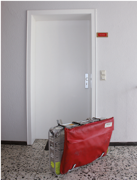
Bild 1.2 Beispiel für die schadenarme Einsatztaktik: Ein Mobiler Rauchverschluss wird am Schlauchtragekorb mitgeführt und kann so vor dem Eindringen in die Wohnung zur Verhinderung einer unkontrollierten Rauchausbreitung in den Treppenraum schnell montiert werden.

Dem hohen Vertrauen der Bevölkerung in die Fähigkeiten der Feuerwehrangehörigen ist natürlich auch die hohe Erwartungshaltung des Hilfesuchenden bzw. Betroffenen geschuldet: Er erwartet – zu Recht! – eine schnelle, pro-