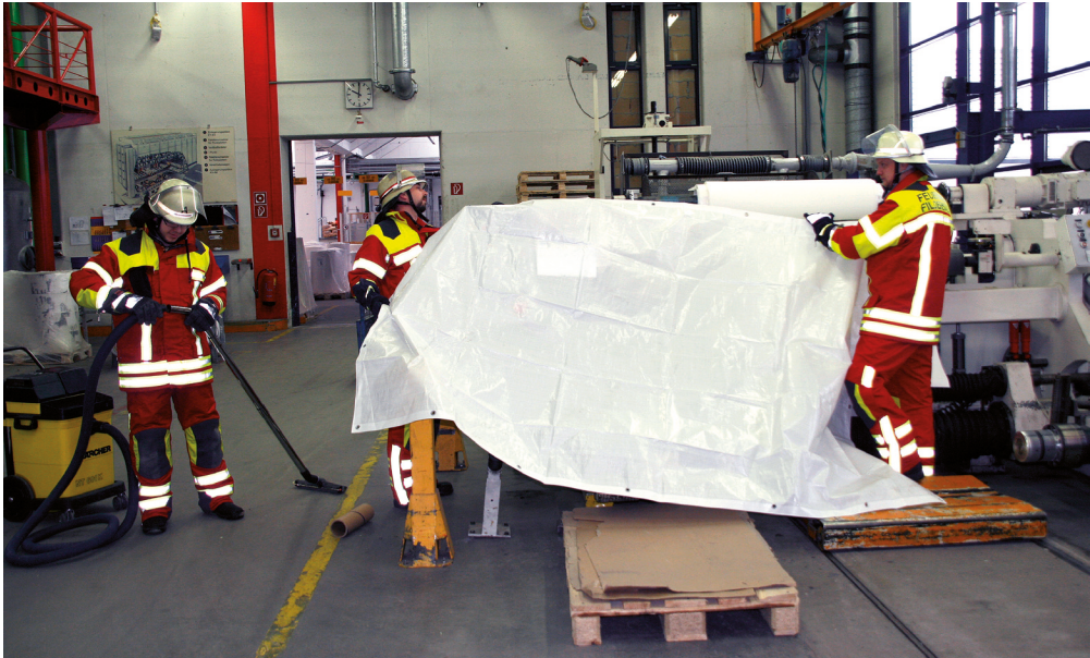
Bild 1.3 Zur Kundenorientierung gehört auch das Business-Continuity-Management. Die Feuerwehr könnte dabei z. B. noch während der Brandbekämpfung Maschinen vor Wasser schützen.

raum bekämpft werden. Gleiches gilt für einen Zimmerbrand, der eventuell über einen Balkon oder das Fenster mittels Leitern der Feuerwehr erreicht und gelöscht werden kann.