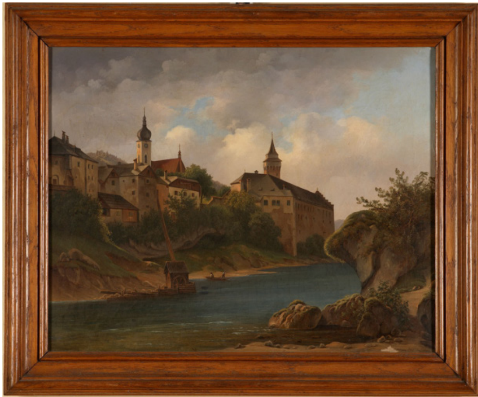
ÖLBILD VON FRANZ WIPLINGER (1847): YBBSPARTIE MIT STADT-ANSICHT (DER BERGFRIED NOCH MIT DACH)

Ab 1840 wurden die gravierendsten Schäden behoben. So wurde erstmals die Brücke über den Schwarzbach aus Stein gemauert, und einsturzgefährdete Gebäude wurden neu errichtet.